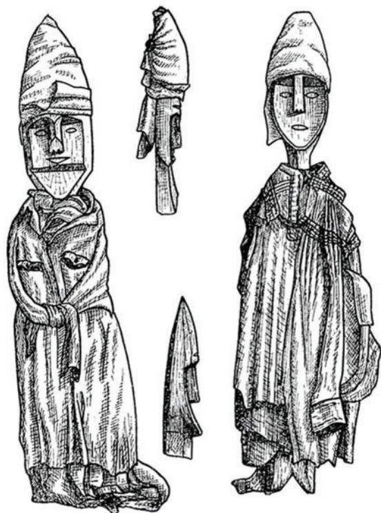
Идолы манси (вогулов)