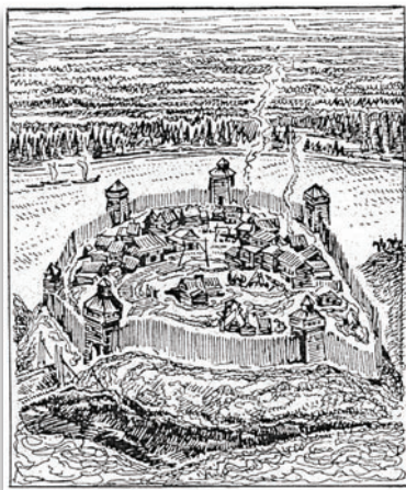
Реконструкция Чердынского кремля. Иллюстрация из журнала «Уральский следопыт». 2011. № 11

Сразу после установления в Перми Великой власти московских князей сюда устремилось множество русских переселенцев. Вскоре они стали численно доминировать на территории Чердынского края и заметно потеснили местных жителей, вынужденных частью переселиться на Урал и в Зауралье, в еще не покоренную Югру; другая их часть осела в Западном Предуралье и за короткий срок обрусела. Русские же воспользовались выгодным в стратегическом отношении местом и на семи разделенных оврагами холмах, или «горах», на правом берегу реки Колвы, в шести километрах от слияния ее с другой важнейшей водной