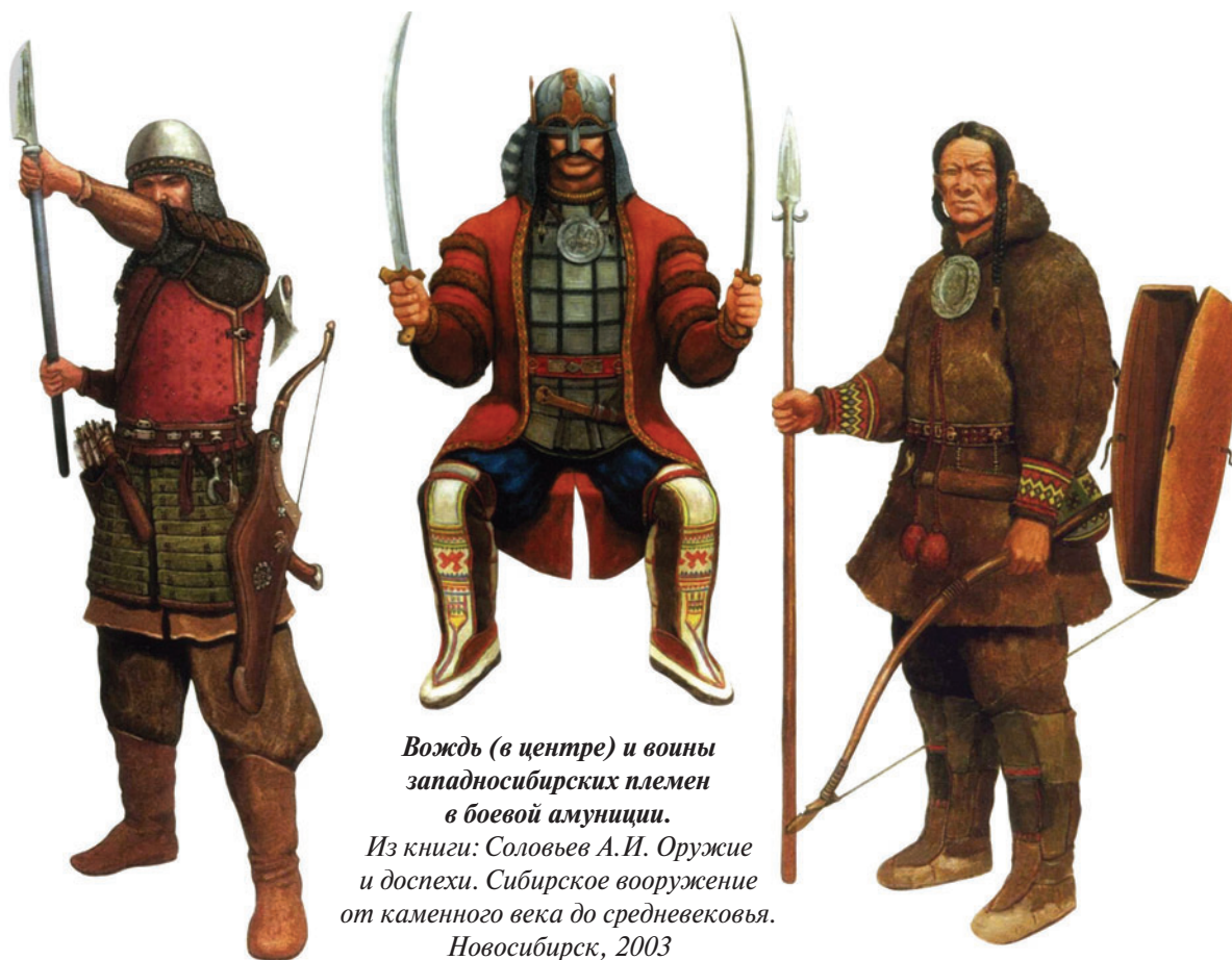
Вождь (в центре) и воины западносибирских племен в боевой амуниции.