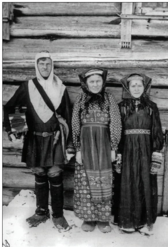
Коми-пермяки в национальной одежде

ска Юрию, и решил «уничтожить самостоятельность Перми». «Лета 6980 (1472. — Н. В.) князь великий повеле воеводе устюжскому Федору Пестрому с устюжаны, белозерцы, вологжаны, вычегжаны воевати Пермь Великие, потому [что] перемечи за казанцов норовили, гостем казанским почести воздавали, людям торговым князя великова грубили» 8 . Последнее обстоятельство летопись называет даже главной причиной похода: «По-видимому, незначительный случай — обида некоторых московских купцов в Перми — произвела войну» 9 .