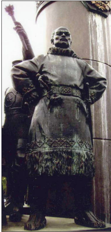
Мансийский вождь. Из музейной экспозиции