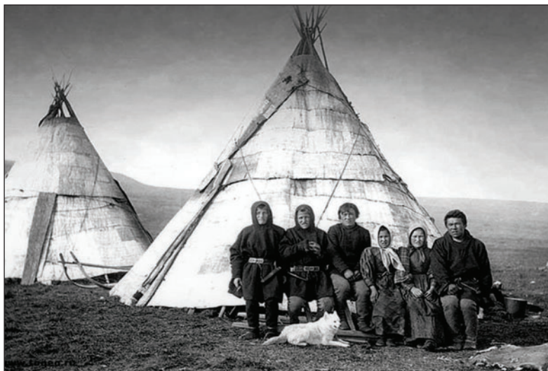
Манси из Чердынского уезда

Город Чердынь возник, по имеющимся данным, не позднее X века как укрепленное поселение коми-пермяков на важнейшем торговом пути в Сибирь. Одним из первых шагов Москвы по закреплению за собой Перми Великой стало крещение здешних племен. В 1455 году туда из Усть-Выми, что в Перми Вычегодской, отправился епископ Пермский Питирим. «Приездил владыко