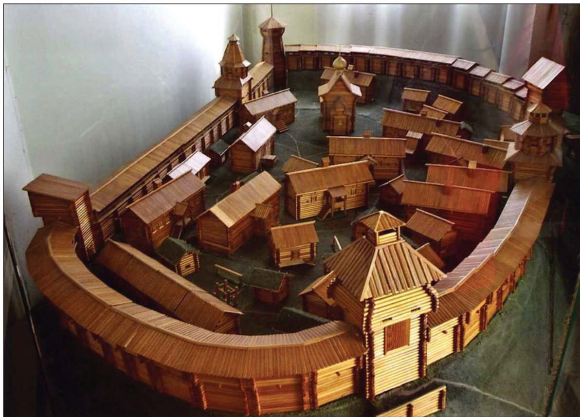
Макет Чердынского кремля. Из музейной экспозиции

двадцатая часть домов и одна церковь от одного уцелели; он поглотил остатки старых памятников» 25 .