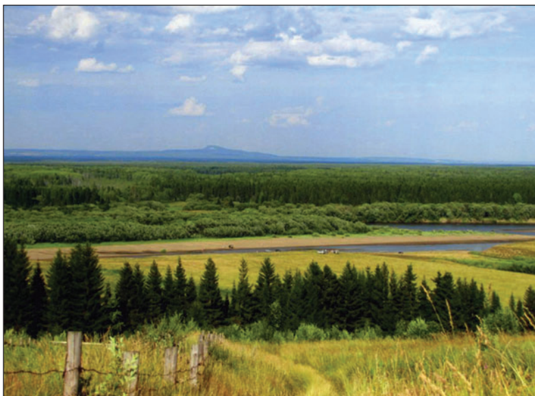
Вид на реку Колву и гору Полюдов Камень.

Лесные чащи Перми Великой — приуральская тайга — изобиловали птицей и зверем. На территории, впоследствии вошедшей в Чердынский край (уезд), были развиты преимущественно рыболовство и охота. Главная добыча охотников — соболь, куница и песец, дикий олень. В верховьях Вишеры на высоких горных грядах, весной покрывающихся обширными ягельниками, вогулы кочевали со стадами одомашненных оленей. Пушнина составляла основной предмет дани и местной торговли. Жители Перми Великой еще до прихода на Урал русских поддерживали тесные торговые связи со многими странами Востока — Византией, Сасанидской Персией, Хорезмом, Арабским халифатом. Москва долго соперничала с Великим Новгородом за обладание этим богатым «мягкой рухлядью» регионом, через который шел основной поток пушнины из Зауралья в Европу и на Ближний Восток. Начиная от Ивана Калиты, московские князья пытались оспорить политическое господство Новгорода над Чердыню (см. прим. 1). Наконец с утратой Новгорода политической самостоятельности, на карте Московского государства появилось пока еще в значительной мере автономное Великопермское княжество. Произошло это в 1451 году, после того как сопредельная с Пермью Великой Пермь Вычегодская попала под власть Москвы. Тогда Великому князю Московскому Василию II Темному удалось назначить своими наместниками в тех землях представителей уже обрусевшего и перешедшего