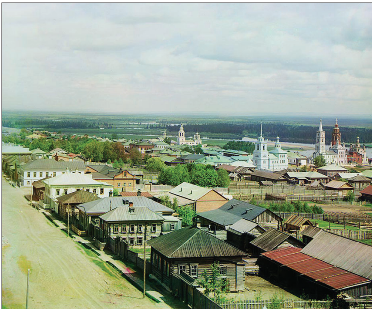
Город Чердынь. 1913 год

Современный город Чердынь и его округа в Средние века входили в состав обширной области Западного Приуралья — Пермь Великой 1 . Местное население — проживавшие на огромных лесных пространствах языческие финно-угорские пле-