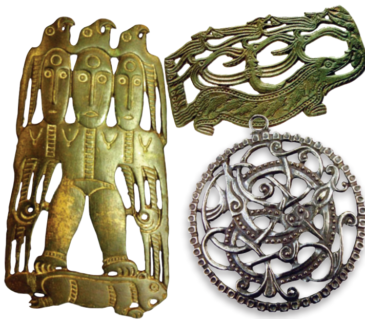
Изделия древней дохристианской культуры Прикамья — бляхи и подвеска

Дальнейшая судьба Чердыни связана с походом русских войск на Пермь Великую в 1472 году. Основанием для этой военной операции стало следующее. Годом ранее «повеле князь великий Иван брату своему Юрию с устюжаны, галичаны, белозерцы, вычегжаньы, пермяки с ратью конною и судовою пойти на казанцов. Стоял Юрий под Казаню 5 дней, к городу не приступал, ожидаючи белозерцев и чердынцов, а чердынцы, убоясь, не пошли, за казанцов задалися» 7 . Иван III вознегодовал, видя, что Великопермский князь, стремившийся ладить и с русскими, и с их врагами татарами, не дал вой-