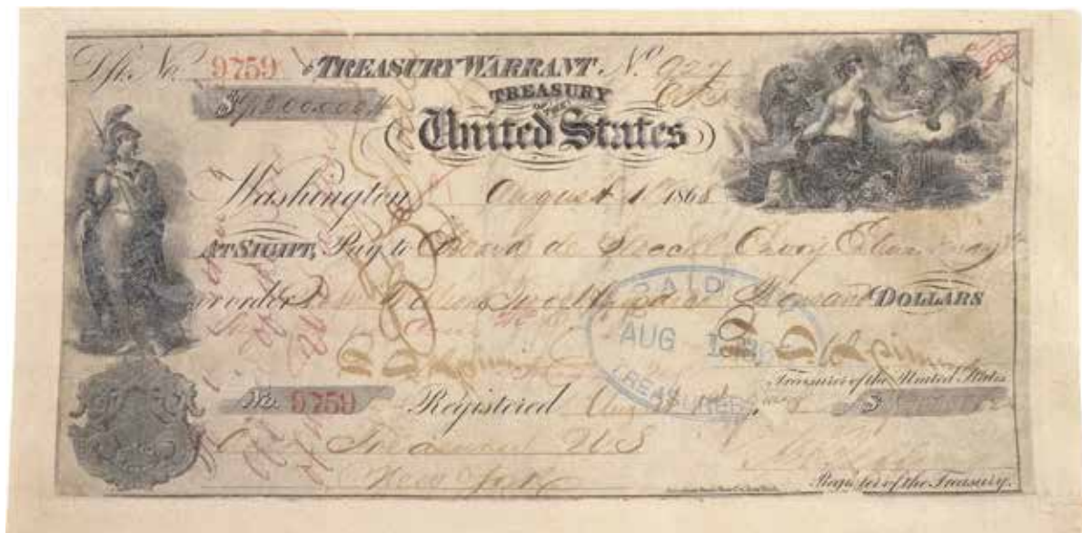
Чек на 7,2 миллиона долларов, которым Америка расплатилась с Россией за покупку Аляски

в принципе не возражали против продажи убыточных в денежном выражении российских владений («колоний») на американском континенте стране, которая на тот момент проявляла по отношению к России дружелюбие. Конечно, говорили они, столь серьезная проблема требует не менее серьезного предварительного обсуждения... Решительно против никто не высказывался. Между тем в светских