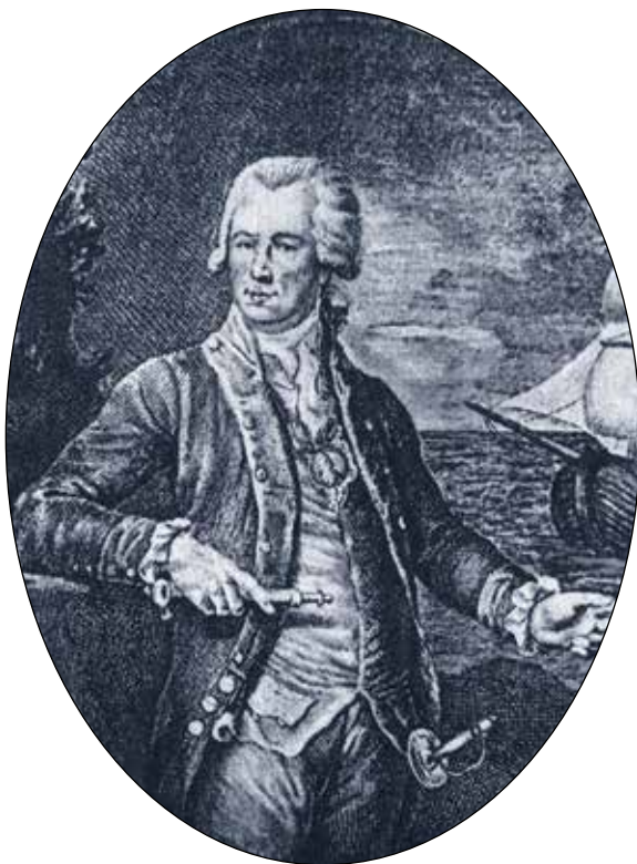
Григорий Иванович Шелихов