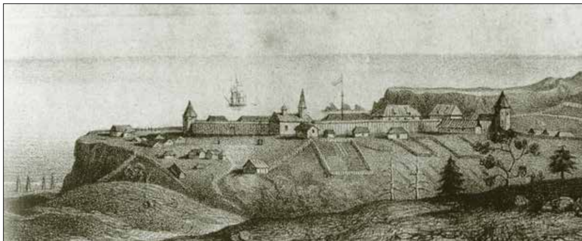
Первые поселения в Русской Америке

Петр I призвал на службу мореплавателя Витуса Ионассена Беринга, в России ставшего Иваном Ивановичем и капитан-командором. Он руководил историческими Первой (1725—1730) и Второй (1733—1743) Камчатскими экспедициями.