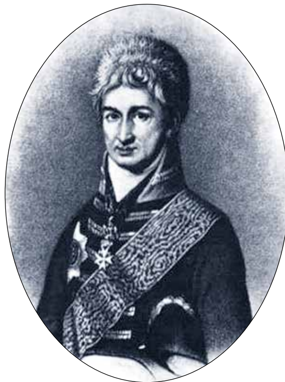
Николай Петрович Резанов

размещалось в Иркутске, к тому времени уже ставшем неофициальной столицей Востока России. Одним из учредителей РАК являлся дипломат, путешественник, предприниматель Николай Петрович Резанов (1764–1807), высочайше назначенный «корреспондентом», то есть исполнителем функций правительственного контролера за деятельностью компании, а затем возглавивший правление РАК. В целях поиска удобных морских маршрутов к Русской Америке Резанов инициировал первую отечественную кругосветную экспедицию И.Ф. Крузенштерна и Ю.Ф. Лисянского (1803–1806). Путь на Аляску через Сибирь и Камчатку был долог и дорог. Одно дело — отправлять легковесную пушнину на отечественные рынки и оттуда в Европу, другое — везти в обратном направлении все необходимое для обитателей «Большой земли». Опираясь на поддержку императора Александра I и его окружения, Российско-Американская компания во главе с Н.П. Резановым основала на северных берегах Тихого океана ряд поселений; принимала активное участие в хозяйственном освоении Приамурья и острова Сахалин; организовала 25 экспедиций, в том числе 15 кругосветных; провела значительную исследовательскую работу на Аляске