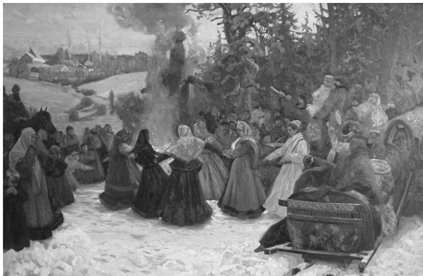
С. Кожин. Масленица. Проводы зимы. XVII в. 2001

Задание 12. Подготовьте сообщение (презентацию) о традиционных древних праздниках вашей страны, используя дополнительную литературу и интернет-ресурсы.