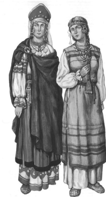
Волынянка и древлянка