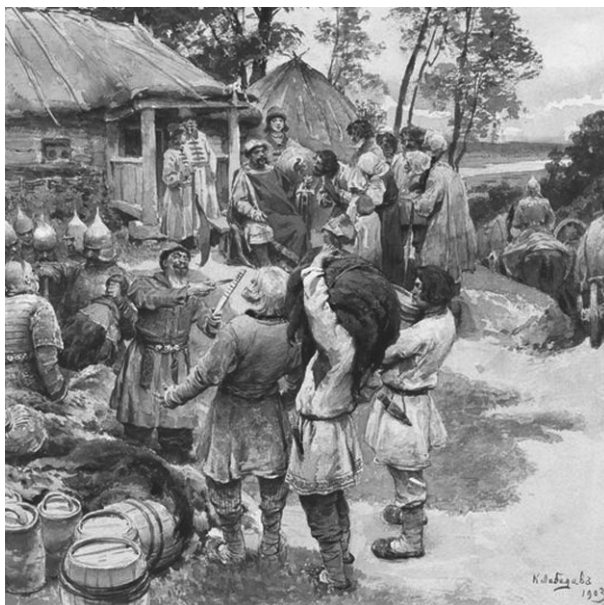
К.В. Лебедев. Князь Игорь собирает дань с древлян в 945 году. 1903

У Перуна было много родственников и помощников: гром, молния, град, дождь, русалки и водяные*, ветры-сыновья. С принятием христианства культ Перуна стал культом святого Ильи. Славяне считали, что Илья-пророк ездит во время грозы по небу и истребляет молниями чертей.