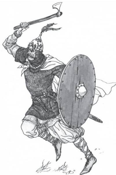
Дружинник киевского князя Владимира Святославича