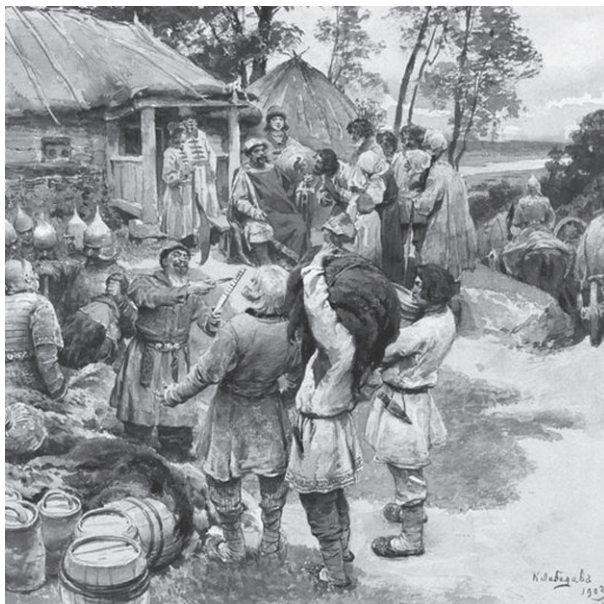
К.В. Лебедев. Князь Игорь собирает дань с древлян в 945 году. 1903

Сварог управлял светом, огнём и воздухом. Он бог- творец и законодатель , отец Сварожичей. Считают, что Сварог научил славян обрабатывать металлы. Когда Сварог завершил создание Земли и людей, он отошёл от дел, передав власть своим потомкам , поэтому славяне никогда не посвящали ему храмов, но в храмах его супруги находились его изображения.