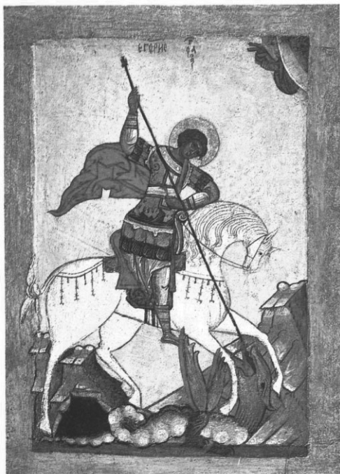
Георгий Победоносец. Икона. XV век

Даждьбог (Дажбог) в летописи отождествляется с солнцем. Даждьбог — сын Сварога, бога неба. Изображался он как всадник с большой головой — солнцем. День Даждьбога — воскресенье, его металл — золото, его камень — яхонт , священное животное — лев .