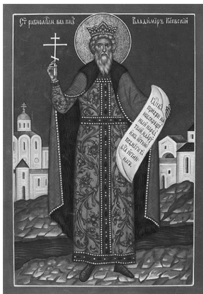
Святой равноапостольный князь Владимир. Икона

Ранние сведения о восточнославянской мифологии восходят к летописным источникам. Согласно «Повести временных лет»*, князь* Владимир* попытался создать в 980 году общегосударственный языческий пантеон*. В Киеве, рядом с княжеским двором, он поставил идолов*: деревянного Перуна* с серебряной головой и золотыми усами, затем Хорса*, Дажьбога*, Стрибога*, Смаргла* и Мокошь*. Как полагают исследователи, каждый из богов пантеона был главным богом одного из восточнославянских племён: Перун — полян*, Хорс — древлян*, Дажьбог — северян*, Стрибог — новгородских словен*, Смаргл — дреговичей*, Мокошь — кривичей*, а верховным богом всех славян выступал Сварог.