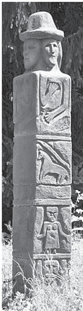
Збручский идол — Род

сливаться / слиться (с кем? с чем?) _____ собственный _____ составлять / составить (что? с чем?) _____ творог _____ увеличение _____ украшать / украсить (что?) _____ устанавливать / установить (что?) _____ фольклор _____ характеристика (кого? чего?) _____ христианский _____ языческий _____ язычество _____