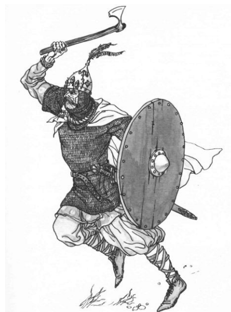
Дружинник киевского князя Владимира Святославича