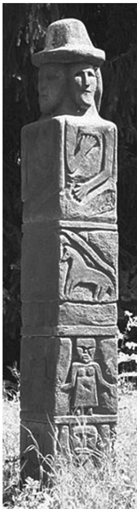
Збручский идол — Род

Научные знания о религии древних славян очень скудны из-за малого количества источников . И поэтому трудно установить границы между язычеством* в целом и восточнославянским язычеством как религией восточных славян* . Хотя надо отметить, что язычество восточных славян имело некоторые собственные характеристики .