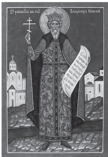
Святой равноапостольный князь Владимир. Икона

скотоводство _____ супруг / супруга = муж / жена _____ творец _____ управлять (чем?) _____ христианство _____ честь _____ чёрт _____