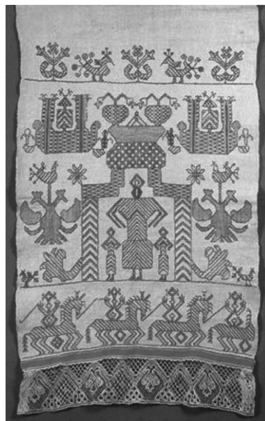
Капище* Мокоши. Вышивка на полотенце. XIX век

Таким образом, в своём пантеоне Владимир установил идолы богов, которые у разных восточнославянских племён были главными. Это было сделано, скорее всего , с целью объединения этих племён вокруг Киева. Но эта попытка не была долговременной и сменилась установлением новой веры — христианства.