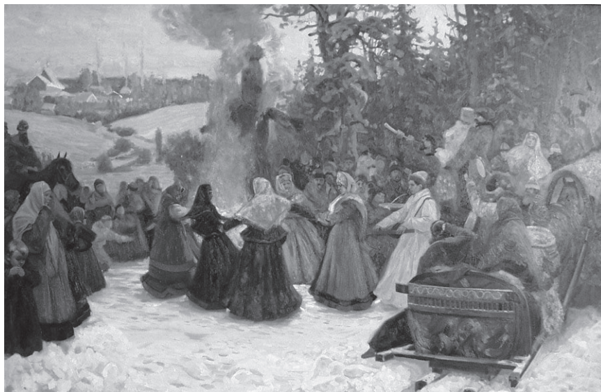
С. Кожин. Масленица. Проводы зимы. XVII в. 2001

Задание 12. Подготовьте сообщение (презентацию) о традиционных древних праздниках вашей страны, используя дополнительную литературу и интернет-ресурсы.