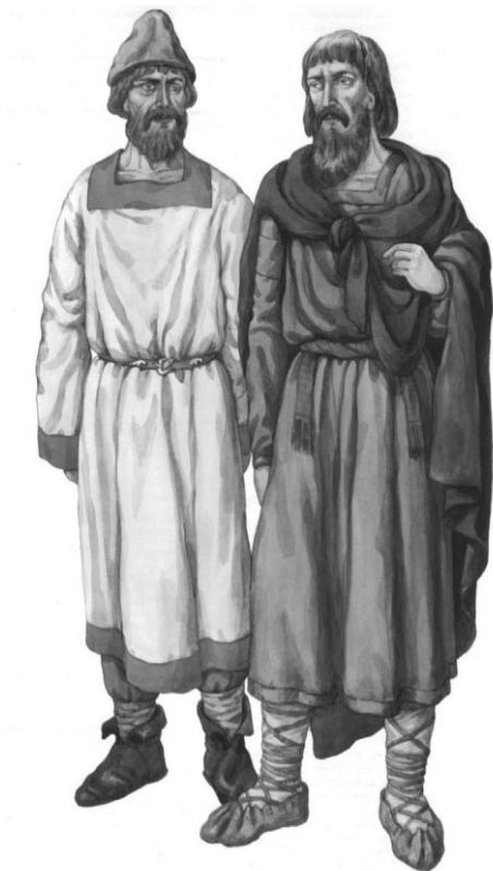
Волынянин и полянин в повседневной одежде

Задание 14. Подготовьте сообщение о древних богах, которых почитали в вашей стране, используйте дополнительную литературу и интернет-ресурсы.