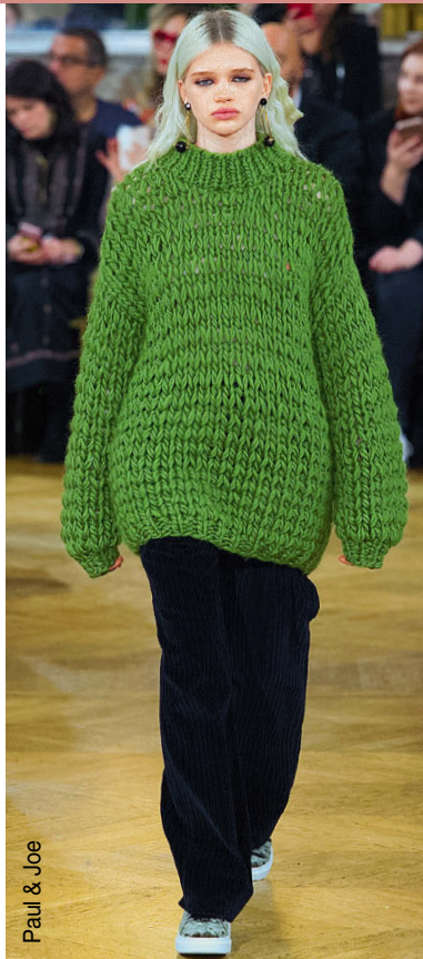
Paul &amp; Joe

Константа зимних коллекций – вещи из вязаного и кроеного трикотажа, готовые подарить своим обладателям тепло, уют и комфорт. Именно функциональность трикотажа нередко определяет его дизайн, основанный на простоте, целесообразности, умеренности в детализовке. Но это не означает, что дизайнеры не дают волю фантазии в работе над вязаными вещами, напротив – именно возможность создать вещь «с нуля», точнее, с нити, позволяет получить интересный результат. Сегодня трикотажных дел мастера вдохновляются классическими приемами, искусством и традиционными ручными техниками. Впрочем, обо всем по порядку.