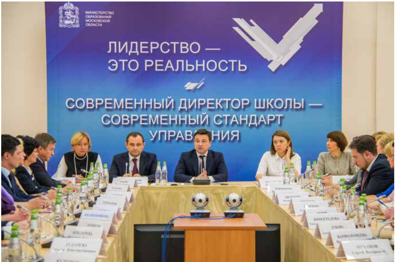
С идеей создания в регионе Клуба директоров школ выступил губернатор Московской области Андрей Воробьев на апрельской встрече с руководителями инновационных школ Подмосквья.