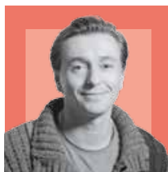
СЕРГЕЙ БЕЗРУКОВ, актер, художественный руководитель Московского Губернского театра

должны прийти современные заводы. Заводы перерабатывающие, заводы по термическому обезвреживанию. Из отходов при этом будут выделяться ценные фракции, которые уходят во вторичную переработку. К 2019—2020 году минимум 50% отходов будет перерабатываться. Выделять землю под развитие полигонов в том виде, в котором они есть, запрещено. Мы выходим на новый этап — это строительство новой отрасли переработки отходов. Шаг такой сделан, территориальная схема принята. У нас есть полгода, чтобы отобрать регионального оператора и выйти на новую систему.