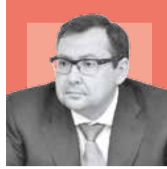
ИГОРЬ ТРЕСКОВ, министр правительства Московской области по дорожному хозяйству

домов и проведения торгов. В марте мы объявим все торги, и в мае подрядчики смогут выйти на объекты. Еще одно поручение губернатора касалось общественного обсуждения плана благоустройства дворовых территорий и адресного перечня. В министерстве создана scgim-группа, которой я руковожу лично. Закреплен показатель, что не менее 1580 общественников должны принять реальное участие в формировании 10% плана (каждый год в Подмосковье благоустраивается не менее 10% дворовых территорий по госпрограмме).