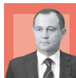
ИГОРЬ БРЫНЦАЛОВ, председатель Московской областной думы

Власти Подмосквья качественно реализуют программу по улучшению жизни в регионе, включающую решение задач в системе ЖКХ, дорожном строительстве, транспортной и экологической сферах. Есть система действий, программа, и она сегодня реализуется очень качественно. Это было показано в цифрах конкретных, то, что сегодня уже чувствуют и видят в своих муниципалитетах жители. Это касается абсолютно каждого муниципального образования, это системное решение задач в ЖКХ, в строительстве дорог, развитии общественного транспорта, экологии — все это программа действий, которая продолжится в этом году. Мособлдума будет вносить поправки в бюджет региона по ключевым вопросам, связанным с качеством воды, ремонтом подъездов и дорог.