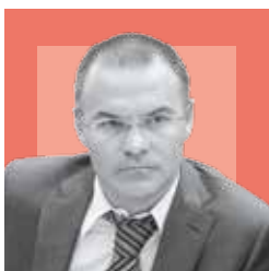
АЛЕКСАНДР КОГАН, министр экологии Московской области

тысяч новых рабочих мест создано в Московской области