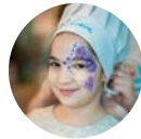
Балашиха Доброго вам завтрака! с. 5