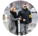
Королев Равные среди равных с. 52