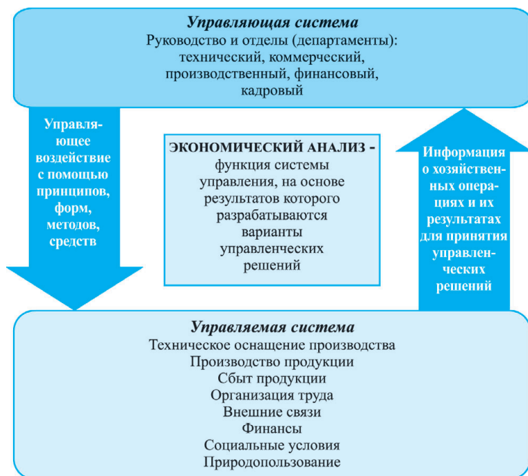
Рис. 1.1. Экономический анализ в системе управления организацией

Схема управления организацией представлена на рис. 1.1.