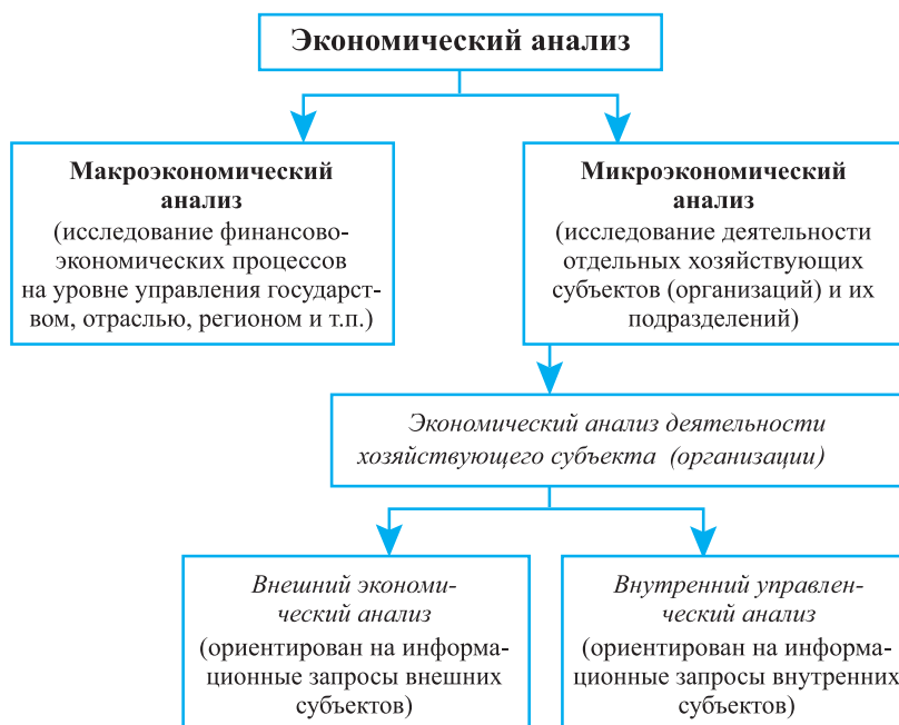
Рис. 1.3. Схема экономического анализа

Экономический анализ как наука по организационному уровню изучаемых процессов подразделяется на макро- и микроанализ (рис. 1.3).