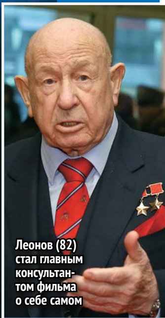
Леонов (82) стал главным консультантом фильма о себе самом