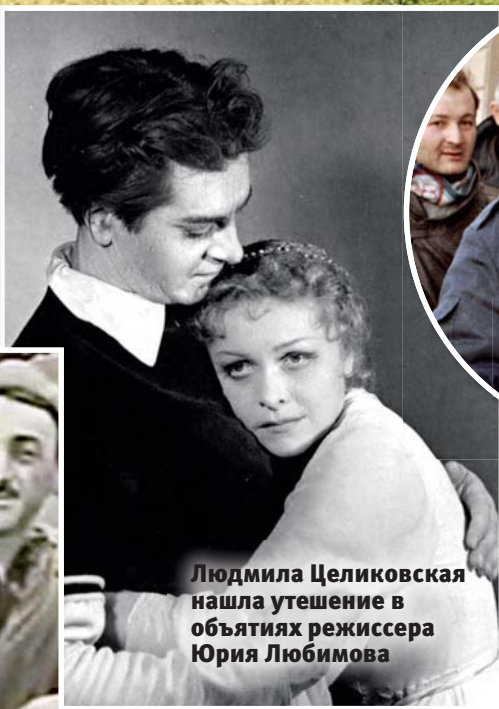
Людмила Целиковская нашла утешение в объятиях режиссера Юрия Любимова