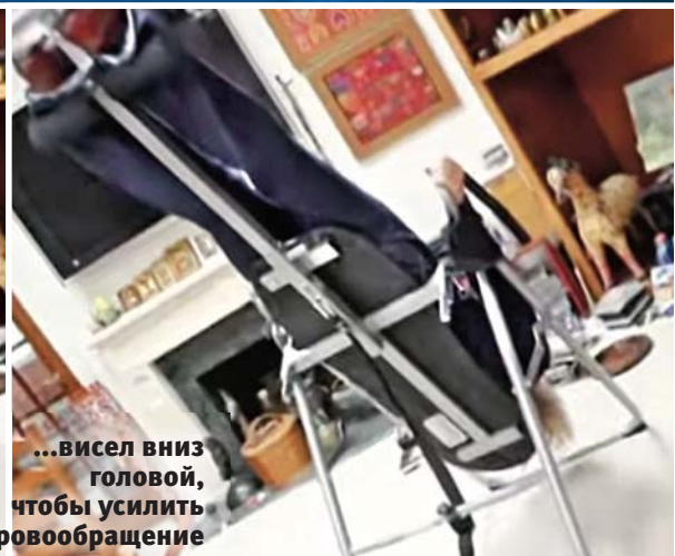
...висел вниз головой, чтобы усилить кровообращение

В еликолепный Морис Джеральд из фильма «Всадник без головы», советский секс-символ Олег Видов, оказывается, вел «тихую войну» со страшной болезнью в последние годы! И скрывал ото всех, как ему плохо.