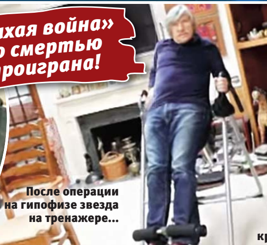
После операции на гипофизе звезда на тренажере...