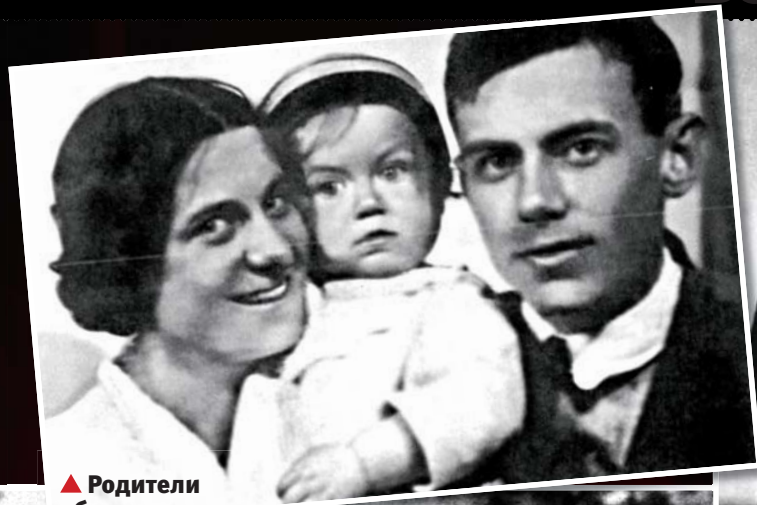
▲ Родители обожали маленького Женьку, но...