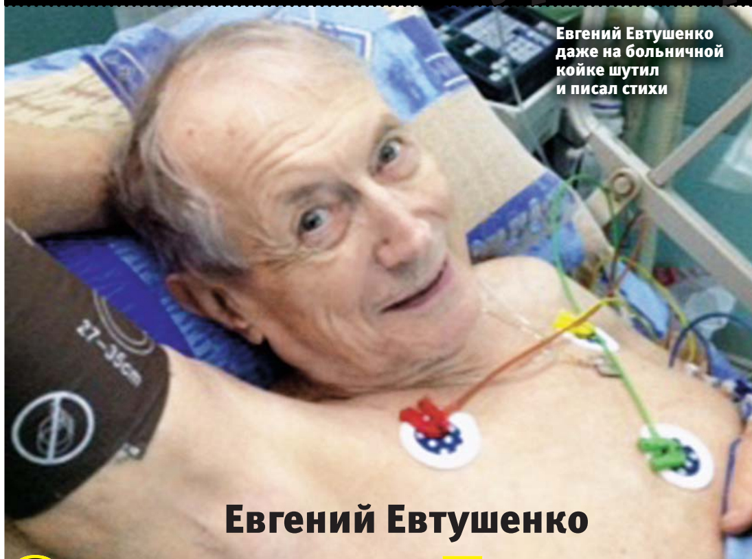
Евгений Евтушенко даже на больничной койке шутил и писал стихи

Рекомендуемая розничная цена 25 руб. Следующий выпуск в продаже с 17 апреля 2017 года