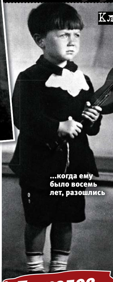
...когда ему было восемь лет, разошлись

Клевета навсегда изменила жизнь будущего поэта