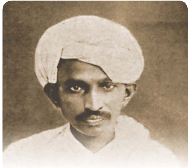
«Полуголый факир», покоривший мир 16