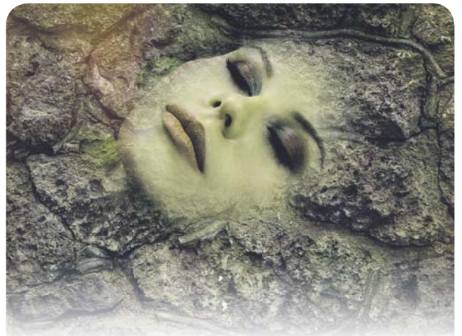
Нетленная плоть 25