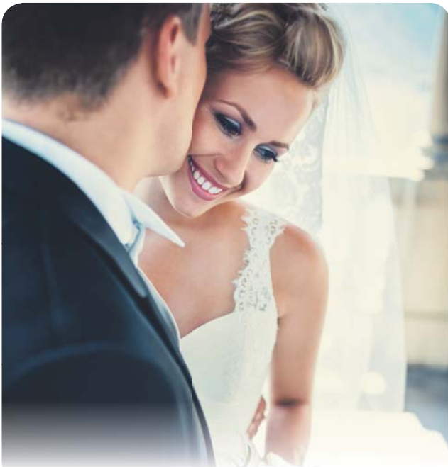
Мистический детектив Злое сердце 12