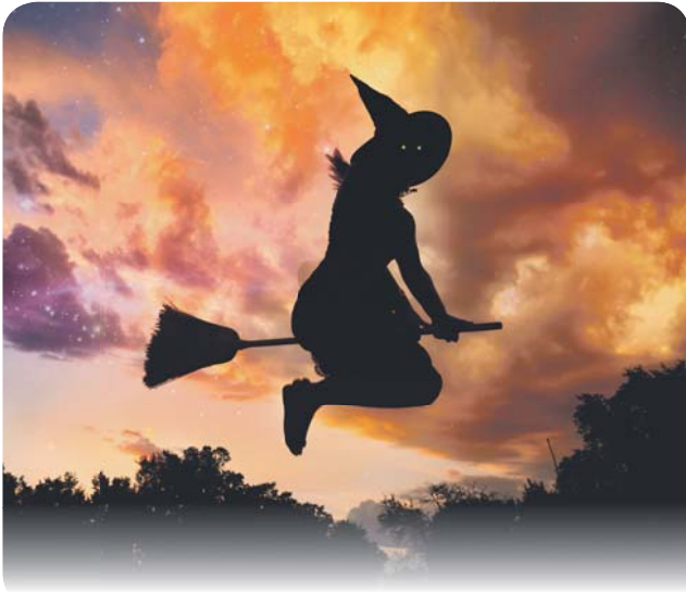
Верхом на метле 10