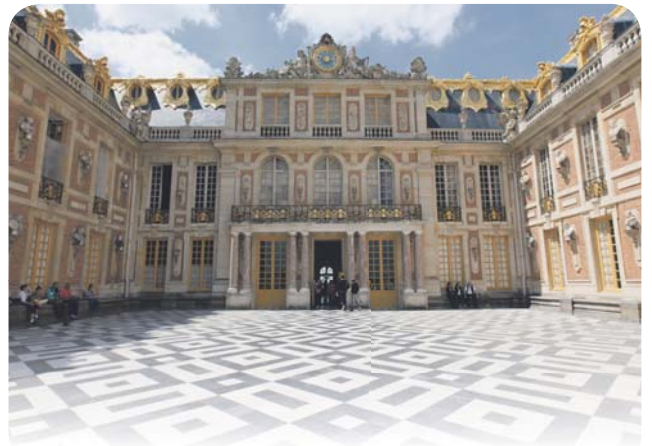
Версальская ведьма 20