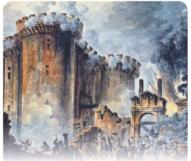
Пророчество Жака Казота 20