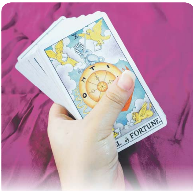
Мистический детектив Спасительница с остановки 12