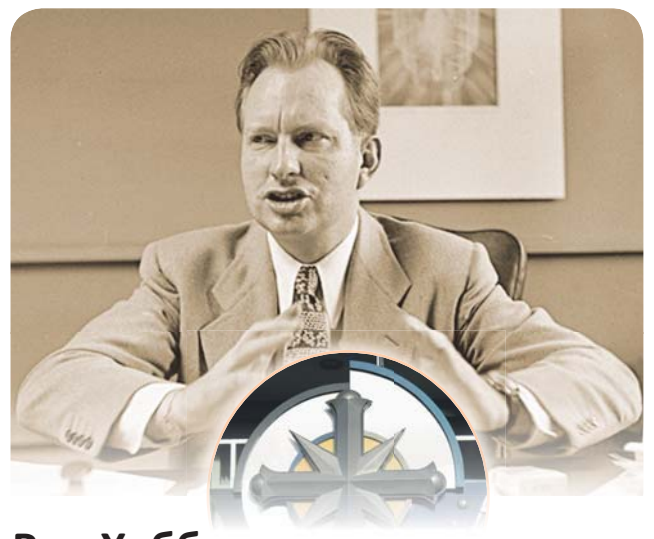
Рон Хаббард: великий и ужасный 28