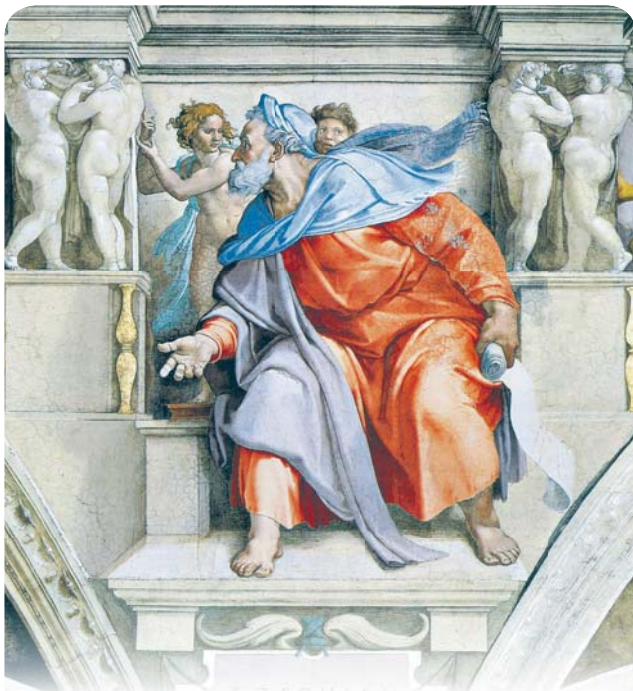
С ним говорил Господь 16