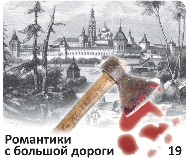
Романтики с большой дороги 19