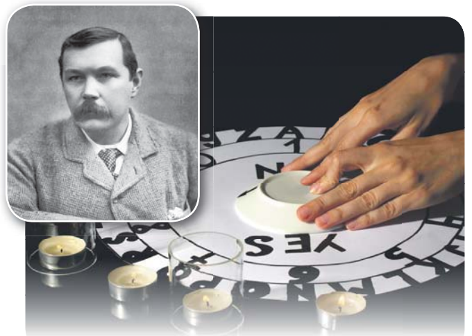
Мистические увлечения Конан Дойла 24