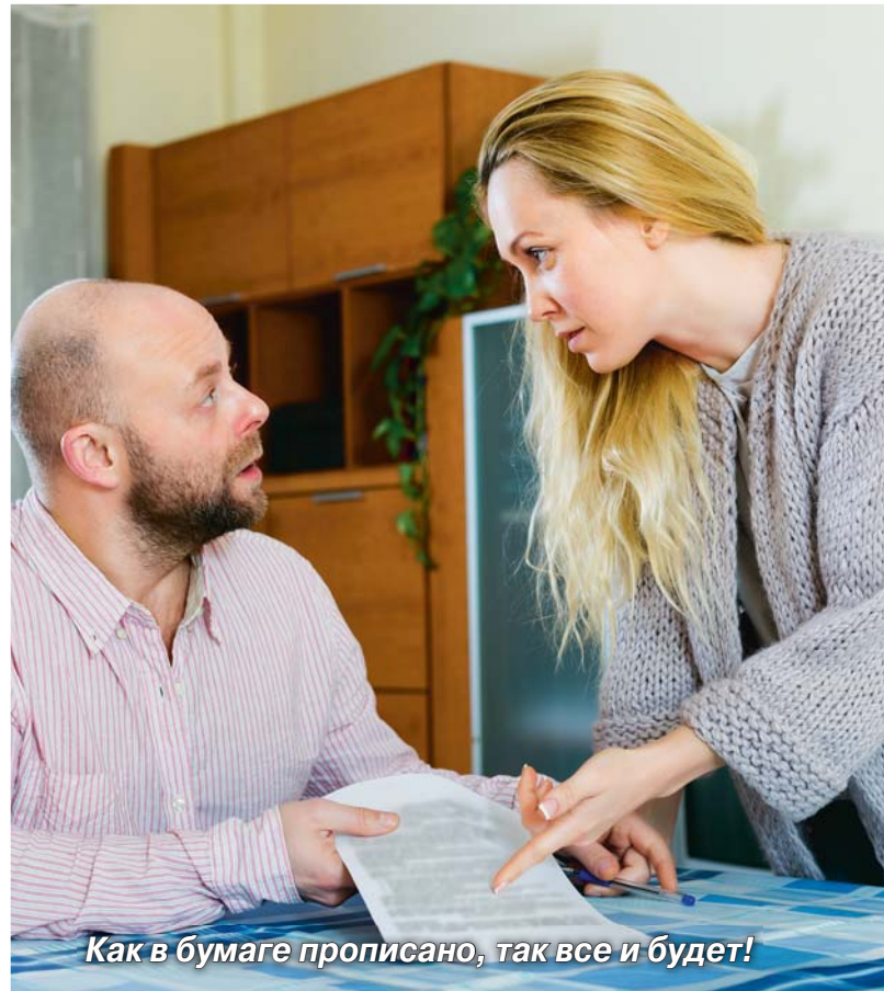
Как в бумаге прописано, так все и будет!