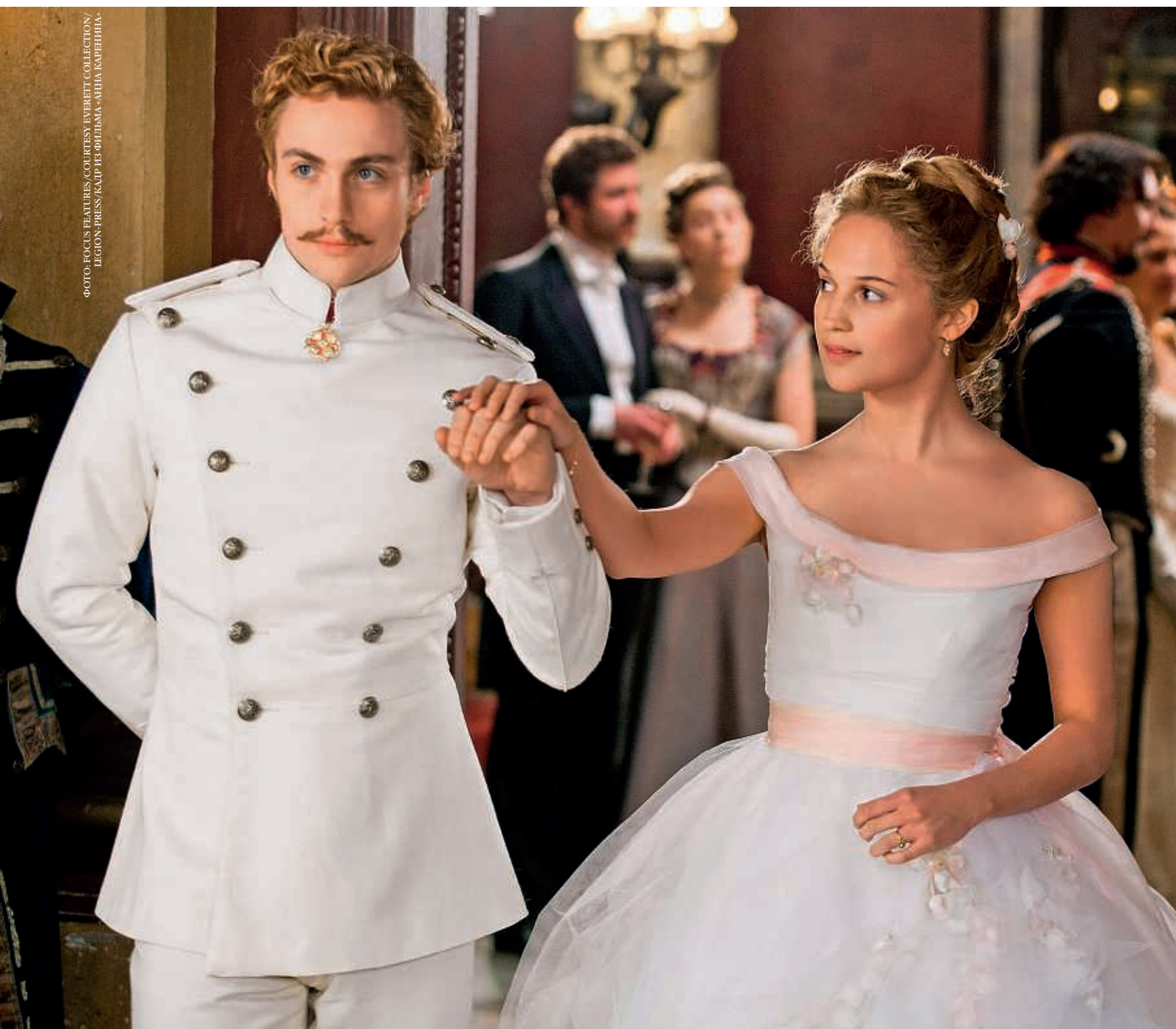
ФОТО: FOCUS FEATURES / COURTESY EVERETT COLLECTION / L'ESION - PRESS / КАРТ. ИЗ ФИЛЬМА «АННА КАРЕНИНА»

Страдания Викандер были вознаграждены. О том, что в Лондоне зажглась новая звезда, услышали и по другую сторону океана. С актером Аароном Тэйлор-Джонсоном, сыгравшим в экранизации романа Льва Толстого роль Вронского