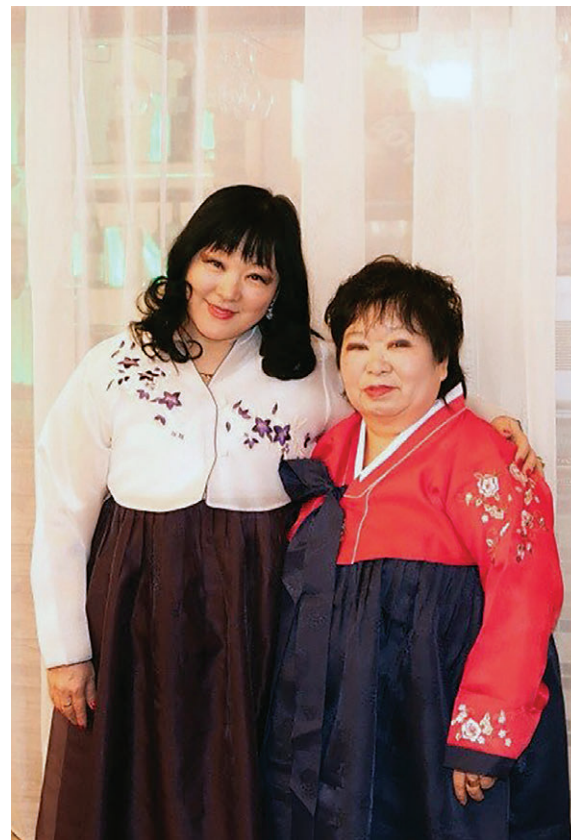
Пермские корейцы в национальных костюмах, 2015 год