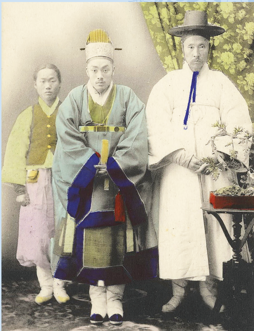
Корейцы в национальных костюмах. Начало XX века