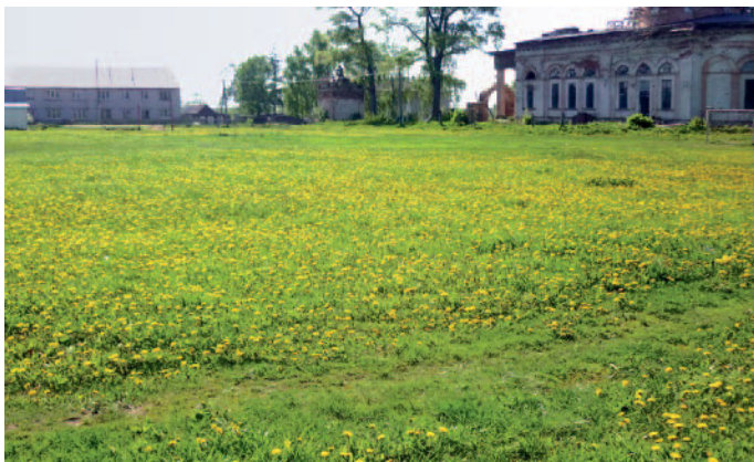
Центральная площадь села

В 1721 году Осинский монастырь сгорел во время пожара, и через три года братию перевели в другую обитель. С этого времени