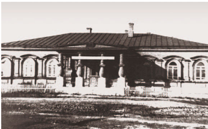
Дом Балясова. 1970-е годы

Здание изначально было двухэтажным: первый этаж – из хорошего красного кирпича, второй – деревянный. Кирпичные стены дома добротные, толщиной один метр. На первом этаже было предусмотрено соединение двух больших комнат путем