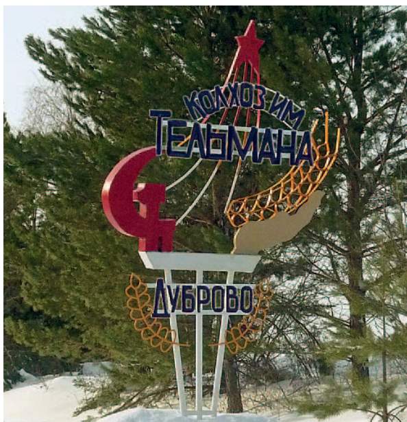
Начало дубровских земель...

По архивным данным, первые упоминания о поселении на речке Осередышной относятся к 1360 году. Сначала были заселены низмен-