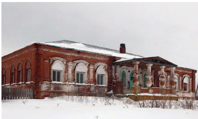
Дом Балясова. 2015 год

В настоящее время собственником здания является администрация сельского поселения, которая планирует открыть здесь центр