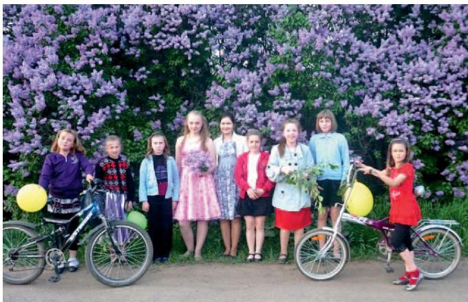
Молодое поколение села Дуброво