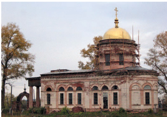
Церковь Святой Троицы. 2010 год

О церковной службе возвещали 12 колоколов. Голос главного колокола был слышен даже в деревне Кобели (Дружная). Этот