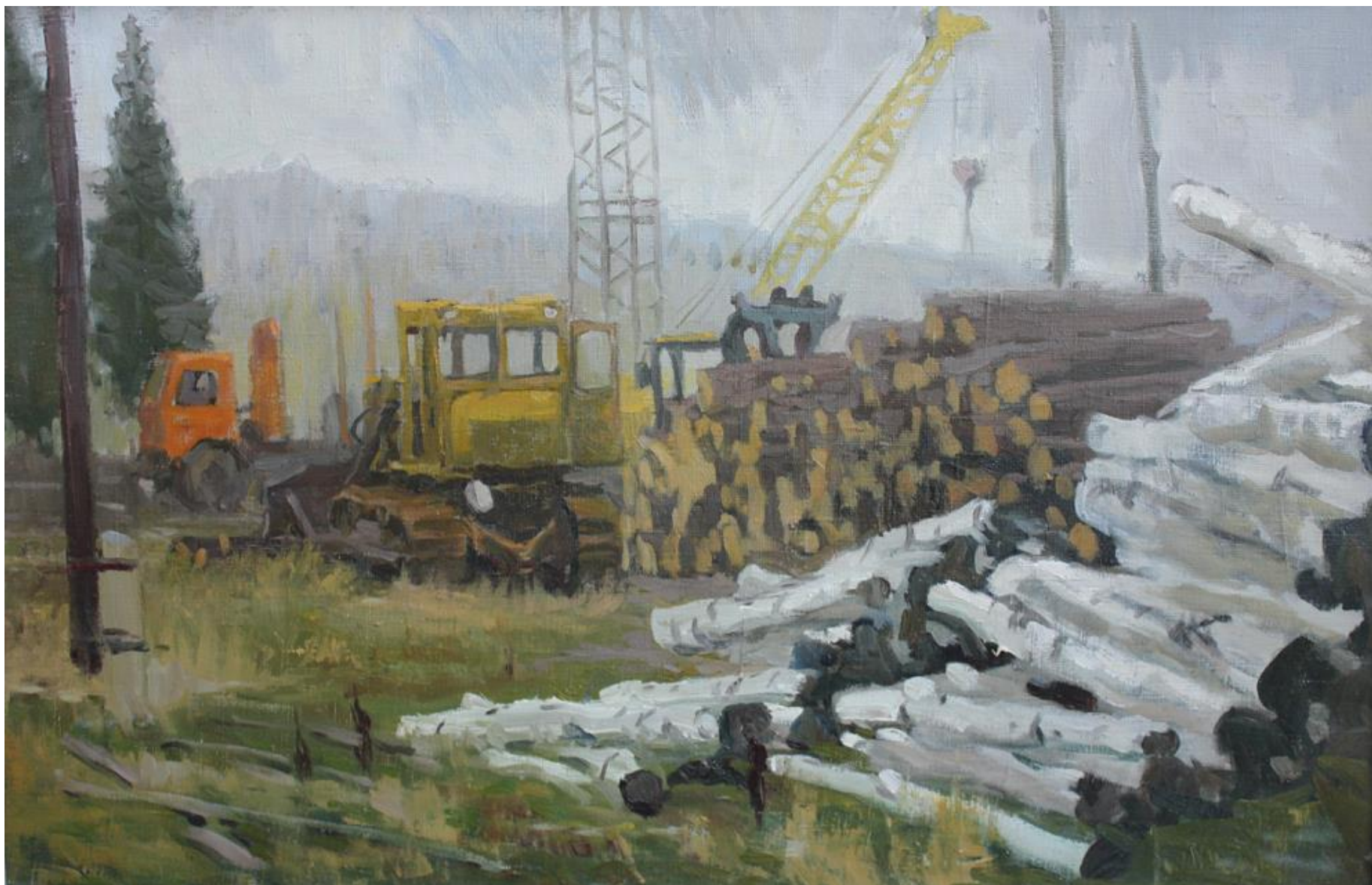
Тягун. Лесхоз. 2014. Холст, масло