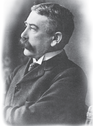
Фердинанд де Соссюр (1857–1913)

Языкознание тесно взаимодействует и с другими науками исторического цикла – археологией, этнографией, антропологией . Обнаруженные археологами при раскопках памятники материальной культуры (жилища, утварь, одежда, украшения, устройства населенных пунктов и т.д.) дают возможность определить ее носителей. Этнографы классифицируют и интерпретируют данные археологических раскопок по типам материальной культуры, что важно лингвистам для выявления областей распространения тех или иных