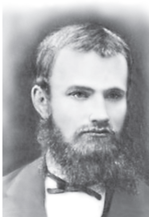
Иван Александрович Бодуэн де Куртенэ (1845–1929)

Тесная связь существует у языкознания с неврологией – наукой о