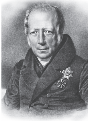
Вильгельм фон Гумбольдт (1767–1835)

Ответвлением логической теории являются представления многих древних народов мира о мудрецах, благородных людях, законодателях как установителях