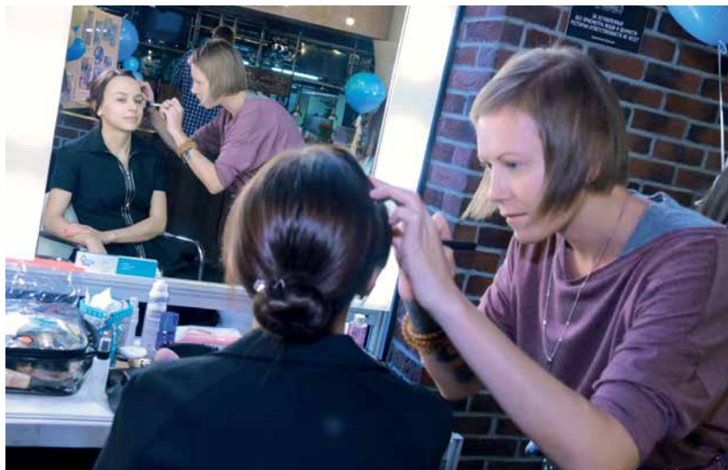
■ Мама узнали секреты макияжа и получили советы по уходу за собой

16,5 тысячи человек реализовали в Подмосквье региональный материнский капитал начиная с 2014 года