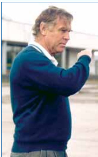
Свен Тумба-Юханссон: После этого я навсегда поверил в советский хоккей

В руководстве больше всего боялись, что кто-то захочет остаться на Западе. Но в те годы это было редкостью. Правда, многие знали, что произошло со сборной Чехословакии в 1950 году. В декабре 1949 года команда играла на Кубке Шпенглера в