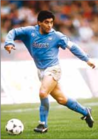
Diego Maradona — главный творец успехов неаполитанского клуба