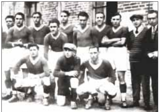
«Наполи» в 1927 году