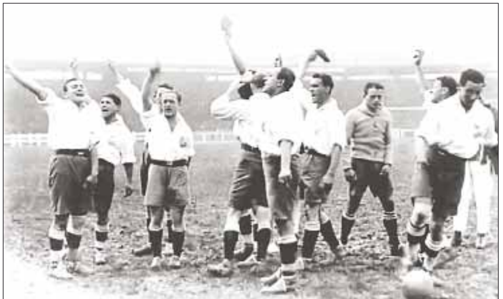
«Насьональ» во время своего знаменитого европейского турне. Париж, 1925 год.

В первом официальном турнире 1901 года «Насьональ» занимает