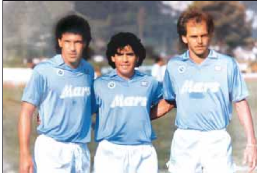
Diego Maradona в окружении звездных бразильских легионеров «Наполи» — Кареки (слева) и Алемана

Оригинальными цветами формы «Наплес» были небесно-голубые майки и черные шорты.