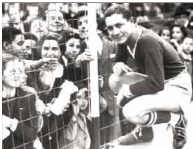
Арсенио Эрико – самый знаменитый воспитанник асунсьонского «Насьоналя»

«Насьональ» 7 раз выигрывал первенство Парагвая (4 из них в любительскую эру), причём седьмой титул был добыт под руководством бывшего легендарного футболиста Эвера Уго Альмейды в 2009 году (чемпионат Клаусура), спустя 63 года после