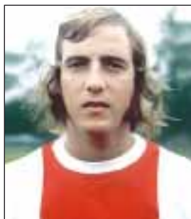
НЕСКЕНС Йоханнес («Йохан») Якобус

(09.01.1930 – 30.03.1999). Полузащитник. Заслуженный мастер спорта СССР (1954), Зтр РСФСР (1986). Выступал за команду «Спартак» Москва (1948–1966, капитан команды в 1955–1964). В чемпионатах СССР провел 367 матчей, забил 37 голов. Чемпион СССР 1952, 1953, 1956, 1958, 1962. Обладатель Кубка СССР 1950, 1958, 1963. Победитель Спартакиады народов СССР 1956 в составе сборной Москвы. За сборную СССР в 1952–1965 провел 54 матча, забил 4 гола. Чемпион ОИ 1956, победитель Кубка Европы 1960. Участник ЧМ 1958, 1962, ОИ 1952. Выдающийся мастер советского футбола. Награжден орденом Ленина (1957), орденом Дружбы (1995).