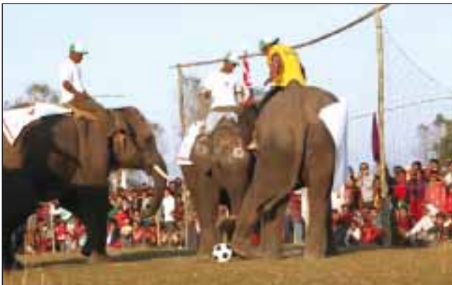
Жалко, что среди слонов не проводятся футбольные турниры, а то бы Непал непременно победил...

Футбол в Непале – один из самых популярных видов спорта. Его развитие в стране началось в 1921 году. Первый неофициальный чемпионат страны прошел в 1934 году, в нём участвовали 12 клубов, а победителем стал «Джавалакхел». Правила во время игры практически не соблюдались, а в составах команд очень часто было больше 11 игроков. Все попытки правительства запретить игру в стране успехом не увенчались.