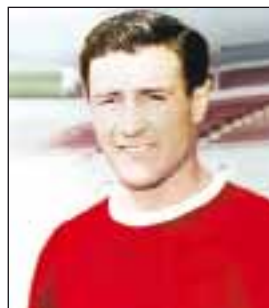
НАВАРРО Рубен Марино

(р. 28.07.1966, Манакор, Мальорка). Больше известен как Мигель Анхель Надаль. Защитник. Воспитанник юношеских команд «Олимпик» Манакор и «Манакор» (1985–1986). Выступал за клубы «Мальорка Атлетико» (1986/1987), «РКД Мальорка» (1986/1987–1990/1991, 1999/2000–2003/2004, 279 матчей, 28 голов), «Барселона» (1991/1992–1998/1999, 208 матчей, 12 голов). Чемпион Испании 1992, 1993, 1994, 1998, 1999, обладатель Кубка Испании 1997, 1998, 2003. Победитель Лиги чемпионов 1992, Кубка кубков 1997, Суперкубка Европы 1992 и 1997, финалист Лиги чемпионов 1994. В еврокубках провел 68 матчей, забил 3 гола. За сборную Испании в 1991–2002 провел 62 матча, забил 3 гола. Участник ЧМ 1994, 1998, 2002, ЧЕ 1996. Получил прозвище Барселонский зверь. Дядя теннисиста Рафаэля Надаля.