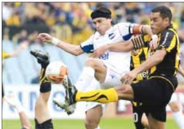
Фрагмент главного дерби уругвайского футбола, в котором сражаются «Насьональ» и «Пеньяроль»

Всего же, с 1939 по 1943 год «Насьональ» из 96 матчей выиграл 77, проиграв только 10, забил в ворота соперников 318 голов, а в свои ворота пропустил только 108 мячей. В этот же период в дерби с «Пеньяролем» футболисты «Насьоналя» одержали победу в 18 матчах (в т.ч. в 10 подряд) из 23-х, и только 4 проиграли. В чемпионате 1941 года «Насьональ» выиграл все матчи (в том