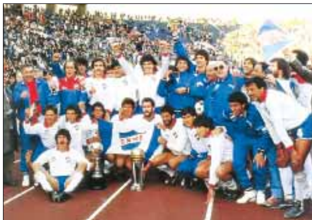
В 1988 году «Насьональ» выиграл и Кубок Либертадорес, и Межконтинентальный кубок

В 1928 году на Олимпиаде в Амстердаме «Насьональ» также