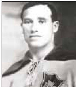
НЕКУ Манозл Нунес

(р. 26.07.1950, Рио-де-Жанейро). Защитник. Выступал за клубы «Америка» Рио-де-Жанейро (1969–1970), «Баррайренше» Португалия (1970/1971, 6 матчей), «Ансотегул» Венесуэла (1971), «Бонсусессо» Рио-де-Жанейро (1972), «Ремо» ПА (1972, 10 матчей), «Крузейро» (1973–1980, всего 410 матчей, 105 голов, в т.ч. в чемпионатах Бразилии – 155 матчей, 34 гола), «Гремио» (1981–1982), «Атлетико Минейро» (1982–1987, всего 274 матча, 52 гола, в т.ч. 77 матчей, 18 голов в чемпионатах Бразилии). Победитель Кубка Либертадорес 1976. 8-кратный победитель лиги Минейру (1973, 1974, 1975, 1977, 1982, 1983, 1985, 1986), чемпион лиги Гаушу 1980. Лауреат приза Серебряный мяч чемпионатов Бразилии 1975, 1979, 1980, 1983. За сборную Бразилии в 1974–1980 провел 21 официальный матч, забил 5 голов. Чемпион ЮА 1976. Участник ЧМ 1974, 1978 (3-е место). Обладатель Кубка Атлантики и Кубка Рио-Бранко 1976. За свой великолепный удар получил прозвище Пушка Америки. Входит в список 80-ти самых результативных защитников по числу голов в национальных чемпионатах.