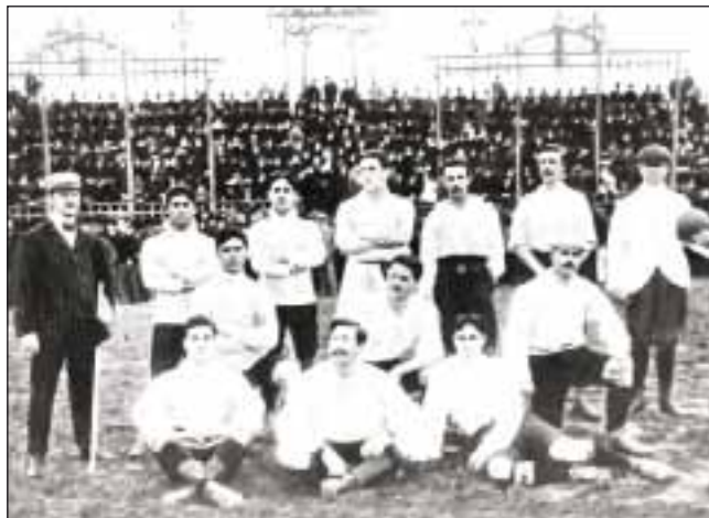
«Насьональ» Монтевидео в 1905 году