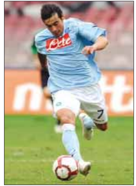
Лучшие представители «Наполи» XXI века (слева направо): Эдинсон Кавани (главный бомбардир в еврокубках), Марек Гамшик, Эсекьель Лавессина (самая выгодная продажа клуба)

Самые крупные победы в Серии «А» – 8:1 над клубом «Про Патрия» (16.10.1955); 7:0 над клубом «Комо» (29.10.1950).