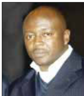
АБЕДИ АЙЮ «Абеди Пеле»