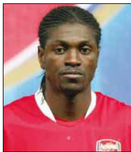
АДЕБАЙОР Шай Эммануэль