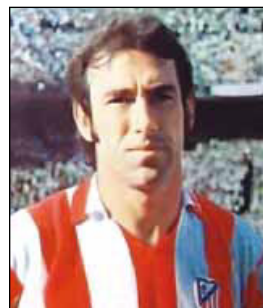
АДЕЛАРДО Аделардо Родригес Санчес

(08.01.1922 – 11.05.1996). Нападающий, полузащитник. Выступал за клубы «Спорт Ресифи» (1938–1942), «Васку да Гама» (1942–1945, 1948–1956, 429 матчей, 301 гол), «Флуминенсе» (1945–1947, 37 голов). Всего в чемпионатах Рио провел 479 матчей, забил 396 голов. Чемпион штата Рио-де-Жанейро 1945, 1946, 1949, 1950, 1952, 1956, чемпион штата Пернамбуко 1939, 1940, 1941. Победитель Южноамериканского кубка 1948. Обладатель Кубка Рио-Бранко 1946, 1950, Кубка Рока 1945. Лучший бомбардир Рио 1949, 1950. За сборную Бразилии в 1945–1953 провел 39 официальных матчей, забил 31 гол. Вице-чемпион мира 1950, обладатель КА 1949, победитель Панамериканских игр 1952. Лучший бомбардир ЧМ 1950 (9 голов, из них 4 в матче Бразилия – Швеция). Обладал высочайшей техникой, мощными ударами с обеих ног, отлично играл головой, один из первых в Бразилии начал применять игру «в стенку». Вместе с Зизиньо и Жаиром составлял одно из лучших атакующих трио в истории бразильского футбола. Один из самых популярных и высокооплачиваемых