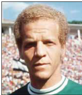
АДЕМИР ФЕРРЕЙРА ДА ГИЯ

(р. 16.03.1968, Адрианополис, штат Парана). Полузащитник. Выступал за клубы «Атлетико Паранаэнсе» (1987–1988, 35 матчей, 1 гол), «Крузейро» Белу-Оризонти (1989–1993, 51 матч, 5 голов), «Интернасьонал» (1993, 11 матчей, 2 гола), «Атлетико Минейро» (1994, 19 матчей, 2 гола), «Гремио» Порту-Алегри (1995–1996, 30 матчей, 2 гола), «Джубило Ивата» Япония (1997–1999, 52 матча, 10 голов), «Коринтианс» (1999–2000, 5 матчей). Чемпион мира среди клубов 2000. Чемпион Бразилии 1996, чемпион Японии 1997, 1999, обладатель Кубка Японии 1998, Кубка и Суперкубка Азии 1999, чемпион штата Парана 1988, чемпион штата Минас-Жераис 1990, 1992, чемпион штата Рио-Гранде-ду-Сул