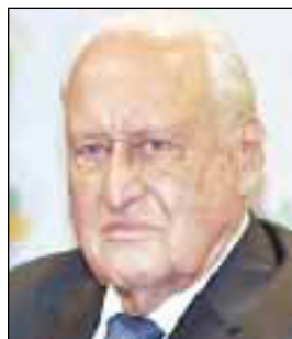
АВЕЛАНЖ Жоао (Жуан)