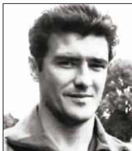
АГУАШ Жозе Пинту Кареальею душ Сантуш

(р. 27.09.1947, Гаага). Защитник, тренер. Выступал за клубы АДО Ден Хааг (1969–1971, 81 матч, 1 гол), ФК Ден Хааг (1971–1973, 1979–1980, 77 матчей, 7 голов), «Рода» Керкраде (1973–1976, 121 матч, 2 гола), ВВ Венло (1976–1979, 74 матча, 6 голов), «Чикаго Стингс» США (1979, 1980, 63 матча, 4 гола), «Спарта» Роттердам (1980–1982, 61 матч, 6 голов), «Берхем Спорт» Бельгия (1982–1983, 10 матчей), «Утрехт» (1983–1984, 39 матчей). Тренировал ДСВП Пийнэкер (1981–1984), ассистент главного тренера национальной сборной Голландии (1984–1987), главный тренер клубов «Хаарлем» (1987–1989), СВВ (1989–1991), СВВ/Дордрехт'90 (1991, 34 матча), национальной сборной Голландии (1992–1994, август 2002–2004, 55 матчей), ПСВ Эйндховен (декабрь 1994–1997, 120 матчей; с июля 2012), «Рейнджерс» Глазго, Шотландия (1998–2002, 194 матча), «Боруссия» Мёнхенгладбах, Германия (ноябрь 2004 – апрель 2005, 18 матчей), сборных ОАЭ (2005, 2 матча) и Южной Кореи (с сентября 2005 по июль 2006, 19 матчей), «Зенита» СПб, Россия (с июля 2006 по 10 августа 2009, 98 матчей), сборной Бельгии (октябрь 2009 – апрель 2010, 5 матчей), голландского АЗ Алкмар (декабрь 2009 – июнь 2010, 18 матчей), сборной России (с 1 июля 2010 по 1 июля 2012, 20 матчей). Всего как тренер провел 432 матча (+248=83-101). Победитель Кубка УЕФА