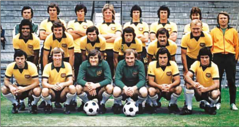
Сборная Австралии на чемпионате мира 1974 года

В 1960 году Австралийская федерация футбола была исключена из ФИФА за нарушение правил использования зарубежных футболистов. В 1963 году восстановлена в правах после выплаты компенсаций заинтересованным клубам.