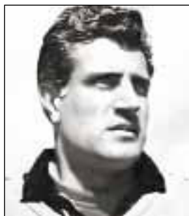
АББАДИ Хулио Сесар Хисмеро

(р. 19.08.1972, Буке, Санта-Фе). Вратарь. Выступал за клубы «Росарио Централь» (1994–1995, 1997, 57 матчей) «Бока Хуниорс» (1997–2006, 2008/2009–2009/2010, 245 матчей в лиге, 100 международных матчей), испанский «Хетафе» (2006/2007–2008/2009, 73 матча), бразильский «Интернасьонал» Порту-Алегри (2010, 28 матчей). Чемпион Аргентины 1998А, 1999К, 2000А, 2003А, 2005А, 2006К. Бронзовый призер ЧМ 2010 среди клубов. Обладатель Кубка Либертадорес 2000, 2001, 2003, 2010, Межконтинентального Кубка 2000, 2003, Южноамериканского Кубка 2004, 2005, Рекопа ЮА 2005, финалист Кубка Либертадорес 2004. Всего в Кубке Либертадорес провел 57 матчей. Победитель Кубка КОНМЕБОЛ 1995. Лучший вратарь Южной Америки 2003, обладатель Трофея Заморы для лучшего вратаря Испании 2006/2007. В 2003–2006 входил в первую десятку лучших вратарей