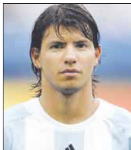
АГУЭРО ДЕЛЬ КАСТИЛЬО Серхио Леонель «Кун»