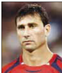
АББОНДАНЦЬЕРИ Роберто («Пато») Карлос

(р. 01.11.1959, Джедда). Нападающий. В 1975–1998 выступал за клуб «Аль-Наср» Эр-Рияд. Лучший футболист Саудовской Аравии 1979, 1980, 1981, 1983, 1986, 1988. Чемпион (1980, 1981) и 5-кратный обладатель Кубка (1981, 1986, 1987, 1990, 1995) Саудовской Аравии. Лучший бомбардир Саудовской Аравии 1979, 1980, 1981, 1983, 1986, 1988. Всего в различных турнирах забил 549 голов в 455 матчах, в т.ч. высшем дивизионе – 190 голов в 218 матчах. За сборную Саудовской Аравии в 1978–1994 провел 139 матчей, забил 67