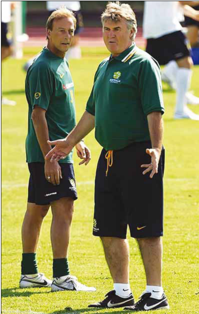
Под руководством Гуса Хиддинка сборная Австралии достигла своего наибольшего успеха — вышла в 1/8 финала чемпионата мира 2006 года

Его вместимость 100018 зрителей (8-й показатель в мире). В январе 2009 года признан одним из семи чудес спорта. Часто местом проведения домашних матчей национальной сборной Австралии по футболу используется второй по вместимости стадион – «Австралия» (иногда его называют «Олимпийским») в Сиднее. Его вместимость после реконструкции 83500 мест. С 2002 по 2007 год носил имя «Telstra Stadium», сейчас официально называется «ANZ Stadium».