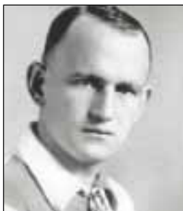
АБЕГГЛЕН II Максимлиан — Макс

(р. 19.04.1970, Хихон). Защитник. Выступал за испанские клубы «Ла Бранья» (1985/1986), «Эстудиантес Самео» (1986–1988), «Спортинг» Хихон (1988/1989–1993/1994, 189 матчей, 13 голов), «Барселона» (1994/1995–2001/2002, 178 матчей, 11 голов), «Депортиво Алавес» Витория (2002/2003, 28 матчей). Чемпион Испании 1998, 1999, обладатель Кубка Испании 1997, 1998. Победитель Кубка кубков и Суперкубка Европы 1997, финалист Лиги чемпионов 1994. Всего в еврокубках провел 56 матчей, забил 5 голов. За сборную Испании в 1991–2000 провел 54 матча, забил 3 гола. Олимпийский чемпион 1992. Участник ЧМ 1994, 1998, ЧЕ 1996, 2000. Работоспособный, выносливый защитник, активно подключающийся к атаке.