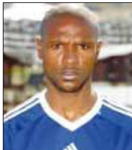
АБИДАЛЬ Эрик Биляль

(р. 11.07.1979, Лион). Защитник. Выступал за клубы «Ля Душер» Лион (1999/2000), «Монако» (2000/2001–2001/2002, 22 матча), «Олимпик» Лилль (2002/2003–2003/2004, 62 матча), «Олимпик» Лион (2004/2005–2006/2007, 76 матчей), «Барселона» Испания (2007/2008–2011/2012, 120 матчей). Чемпион Франции 2005, 2006, 2007, чемпион Испании 2009, 2010, 2011, обладатель Суперкубка Франции 2005, Кубка Испании 2009, 2012, Суперкубка Испании 2009–2011. Победитель Лиги чемпионов и Суперкубка Европы 2009 и 2011. В еврокубках провел 62 матча. Чемпион мира 2009, 2011 среди клубов. За сборную Франции в 2004–2012 провел 61 матч. Вице-чемпион мира 2006, участник ЧМ 2010, ЧЕ 2008. Входил в символическую сборную Европы 2007 по версии УЕФА.