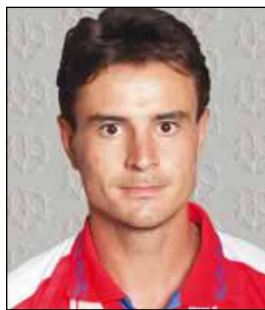
АГИЛЕРА НОВА Карлос Альберто «Пато»

(09.11.1930 – 10.12.2000). Нападающий. Воспитанник клуба «Луситано де Лобито» Ангола (1948–1950). Выступал за клубы «Бенфика» Лиссабон (1950/1951–1962/1963, 282 матча, 290 голов в лиге, 75 матчей, 70 голов в Кубке Португалии; многолетний капитан клуба), «Аустрия» Вена, Австрия (1963/1964, 7 матчей, 2 гола). Чемпион Португалии 1955, 1957, 1960, 1961, 1963, обладатель Кубка Португалии 1951–1953, 1955, 1957, 1959, 1962. Лучший бомбардир чемпионатов Португалии 1952 (28 голов), 1956 (28), 1957 (20), 1959 (26), 1961 (27). Победитель Кубка чемпионов 1961, 1962. Лучший бомбардир Кубка чемпионов 1961 (10 голов). В еврокубках провел 25 матчей, забил 19 голов. За сборную Португалии в 1952–1963 провел 25 матчей, забил 11 голов. Отличался высочайшей техникой владения мячом, отличной тактической подготовкой, быстротой принятия решений.