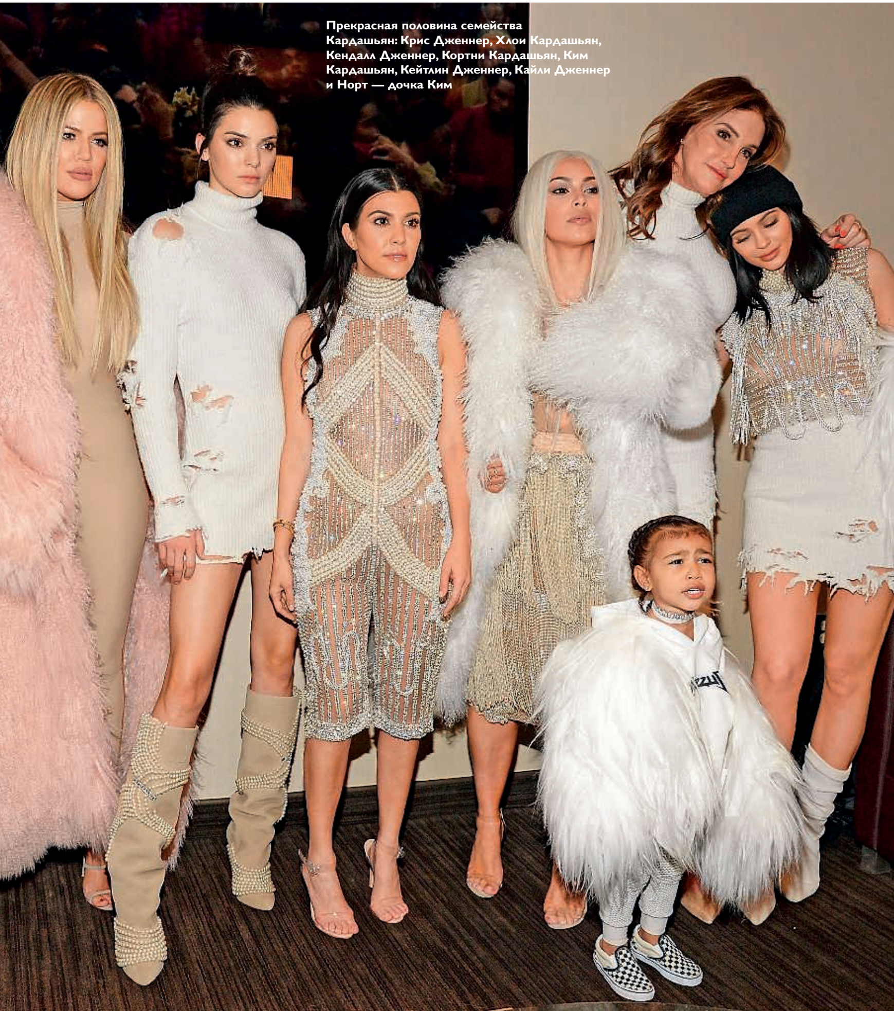
Прекрасная половина семейства Кардашьян: Крис Дженнер, Хлои Кардашьян, Кендалл Дженнер, Кортни Кардашьян, Ким Кардашьян, Кейтлин Дженнер, Кайли Дженнер и Норт — дочка Ким