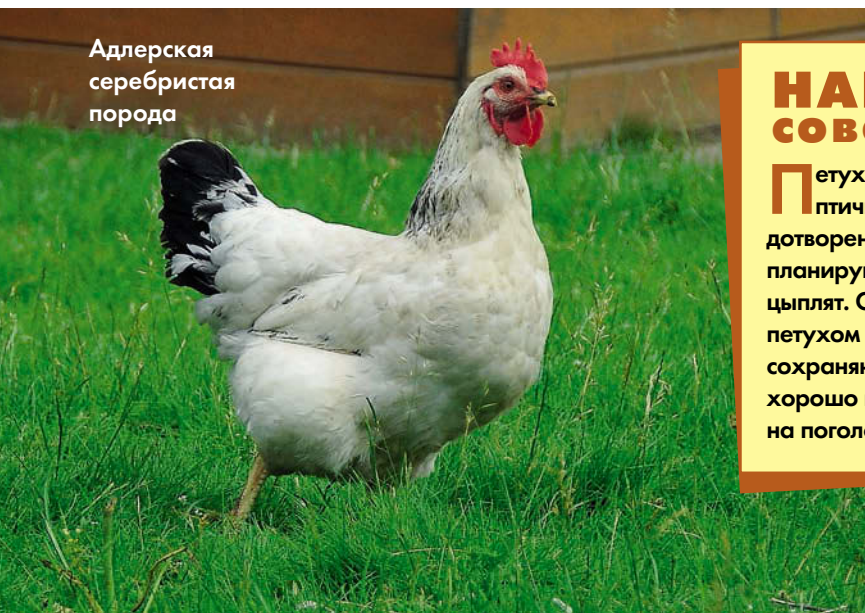
Адлерская серебристая порода

чувствительность к холоду итальянских куропатчатых, заменить их на более морозостойких кучинских юбилейных.