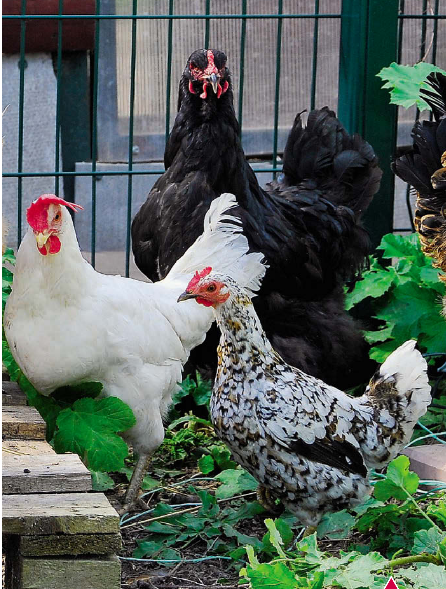
Бентамка брама и леггорн белый

С незапамятных времен в подворьях устраивали перекличку петухи и квохтали куры. Не потеряли они актуальности и на современной дачной усадьбе. Породы по продуктивности делятся на три группы: яичные, мясо-яичные и мясные. Представители еще одной декоративной группы имеют настолько великолепно раскрашенное оперение, схожее с павлиньим и фазаньим, и необычный облик, что их заводят наравне с продуктивными породами, несмотря на низкую яйценоскость и посредственное качество мяса (сibraйт). Есть среди них и приятные исключения (бентамки, кохинхины) с нежным мясом, достаточно крупными яйцами, развитым инстинктом насиживания.