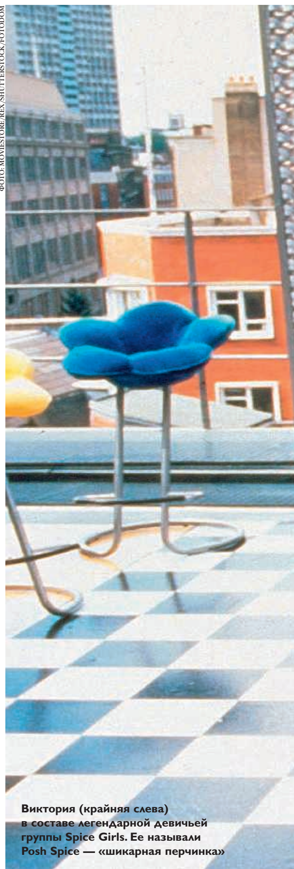
Виктория (крайняя слева) в составе легендарной девичьей группы Spice Girls. Ее называли Posh Spice — «шикарная перчинка»