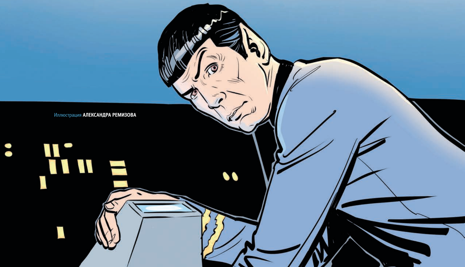
Иллюстрация АЛЕКСАНДРА РЕМИЗОВА

– А сейчас... мистер Нимой – ваш автограф, пожалуйста!