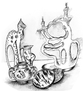
Рис. 1. Композиция декоративных форм, построенная на контрастах и нюансах

• Закон жизненности — это правдивое изображение определенной эпохи, времени, в котором живет художник.