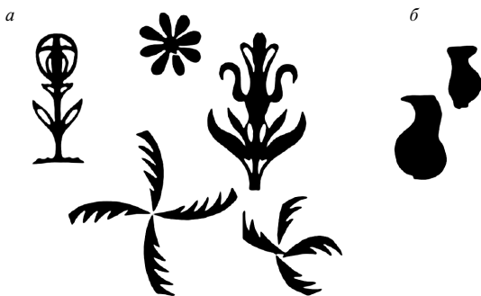
Рис. 3. Симметрия (а) и асимметрия (б) в композиции