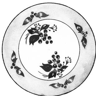
Рис. 2. Декоративная тарелка из фарфора, украшенная орнаментом (равномерный ритм)

Добиться яркой выразительной композиции на плоскости можно различными средствами: линией, штриховкой (штрих), пятном (тональным и цветовым), с помощью линейной пер-