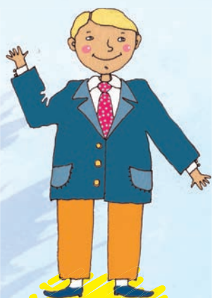
Как Вас Зовут

А вот и первые жители улицы Знакомств: Как Тебя Зовут и Как Вас Зовут . Это братья, они крепко дружат и живут в домиках напротив. Как Вас Зовут - это старший брат, он солидный, взрослый, всегда ходит в костюме и галстуке. Как Тебя Зовут - младший братишка, веселый, озорной и очень общительный. Они очень разные, но это неслучайно. Ведь у детей спрашивают: «Как тебя зовут?», а у взрослых: «Как вас зовут?»