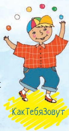
Как Тебя Зовут

А вот и первые жители улицы Знакомств: Как Тебя Зовут и Как Вас Зовут . Это братья, они крепко дружат и живут в домиках напротив. Как Вас Зовут - это старший брат, он солидный, взрослый, всегда ходит в костюме и галстуке. Как Тебя Зовут - младший братишка, веселый, озорной и очень общительный. Они очень разные, но это неслучайно. Ведь у детей спрашивают: «Как тебя зовут?», а у взрослых: «Как вас зовут?»