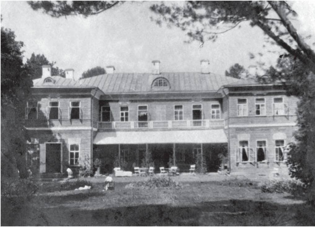
Измалково. Вид дома с южной стороны. Около 1910

двухэтажный, выкрашенный охрой, с белыми оконными фронтонами, он был просторен и удобен. Построен он был «покоем» – с выступами, обращенными на юг. Южная терраса, занимавшая пространство между двумя выступами, была без крыши и на лето затягивалась парусиной. На втором этаже над ней шел узкий балкон – галерея. С этой же южной стороны у подъезда и выхода из гостиной на террасу стояли и лежали чугунные и мраморные львы. Северная терраса, устланная каменными плитами, своими шестью колоннами подпирала верхний открытый балкон. В нижнем этаже дома была большая зала-библиотека, две гостиные, буфет, передняя, девичья и жилые комнаты, а наверху – два кабинета, жилые комнаты и кладовая.