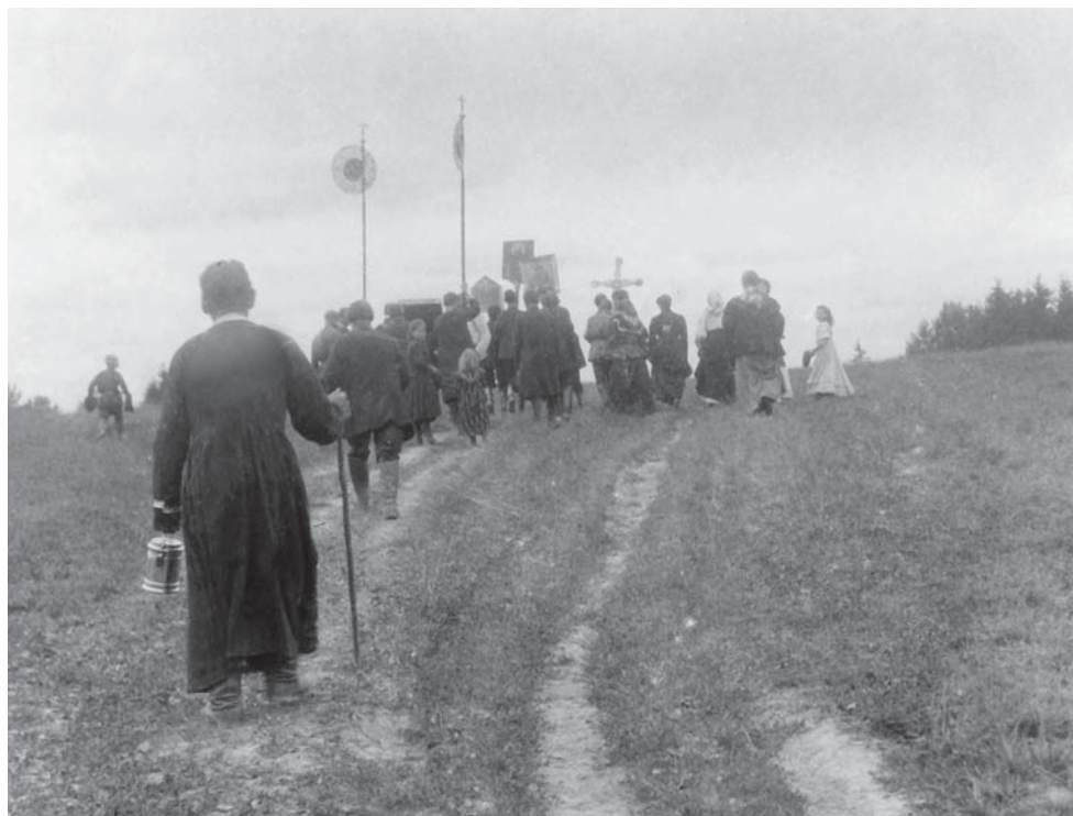
Крестный ход от деревни Переделки в деревню Лукино с молением о дожде. 1914