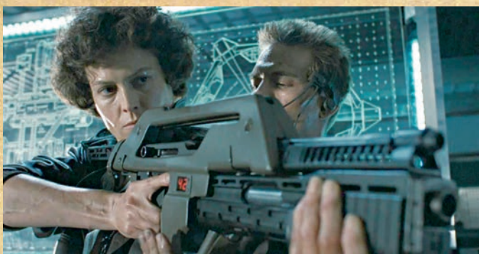
В «ЧУЖОМ» РИПЛИ ЕЩЁ НАПОМИНАЛА «ФИНАЛЬНУЮ ДЕВУШКУ», КОТОРАЯ ВСЕГДА ВЫЖИВАЕТ В УЖАСТИКАХ. НО В «ЧУЖИХ» ОНА УЖЕ ЯВНО БЫЛА САМОЙ КРУТОЙ В КОМАНДЕ

Девушки бывают разные. Одни стреляют из лука, другие управляют космическим кораблём, третьи бьют в кость, а четвёртые просто плохие и не стесняются. Часть человечества страшно удивляется: как же так? Раньше всё это делали только мужчины, а теперь на каждом шагу можно наткнуться на деву, приручающую дракона. Волна феминизма захлестнула современную фантастику. Или нет?..