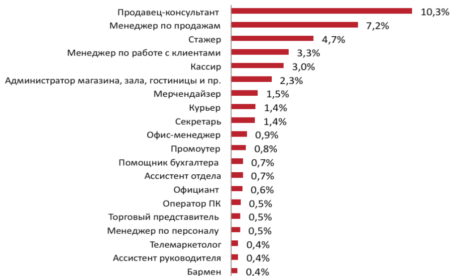
Рис. 1. Топ-20 вакансий (по количеству) в проф. сфере «Начало карьеры, студенты» в России (%), 2 квартал 2014 г.)