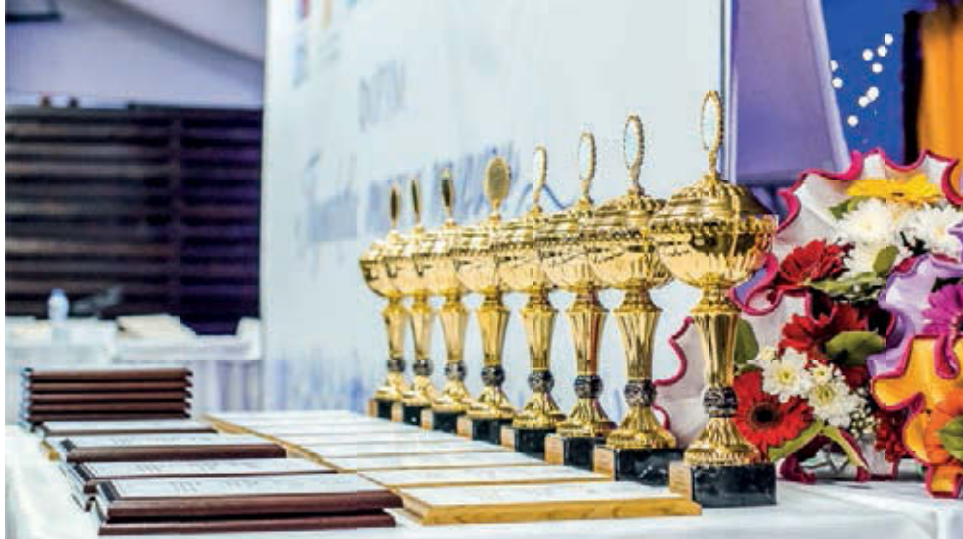
Подведены итоги конкурса «Лучшая организация туристской индустрии»

Журнал зарегистрирован в Управлении Федеральной службы по надзору в сфере связи, информационных технологий и массовых коммуникаций по Москве и Московской области ПН №ТУ50-1331 от 10.04.2012 г. Отпечатано ОАО «Подольская фабрика офсетной печати», Московская область, г. Подольск, Революционный пр., д. 80/42. Тираж 10 000 экз. Заказ № 22338 Подписано в печать 28.12.2015 г. ПОДПИСНОЙ ИНДЕКС НА ПОЛГОДА 15513 ПО КАТАЛОГУ «ПОЧТА РОССИИ»