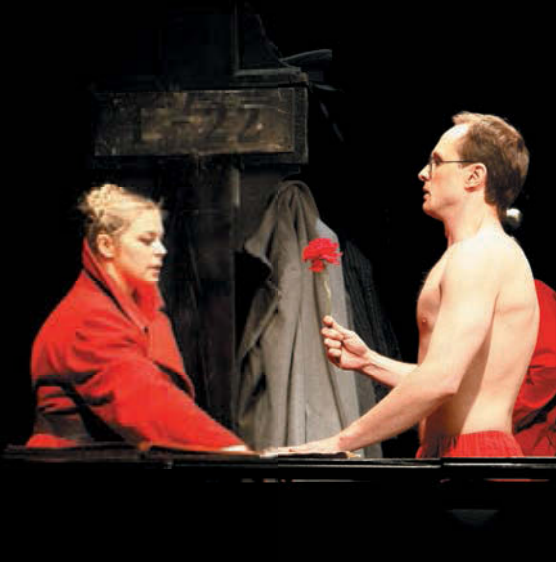
«Табакерка» вышла на областную сцену