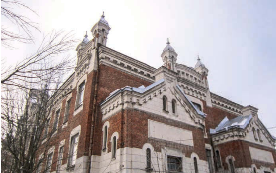
До 2018 года будут разработаны границы и предмет охраны для 20 исторических поселений регионального значения