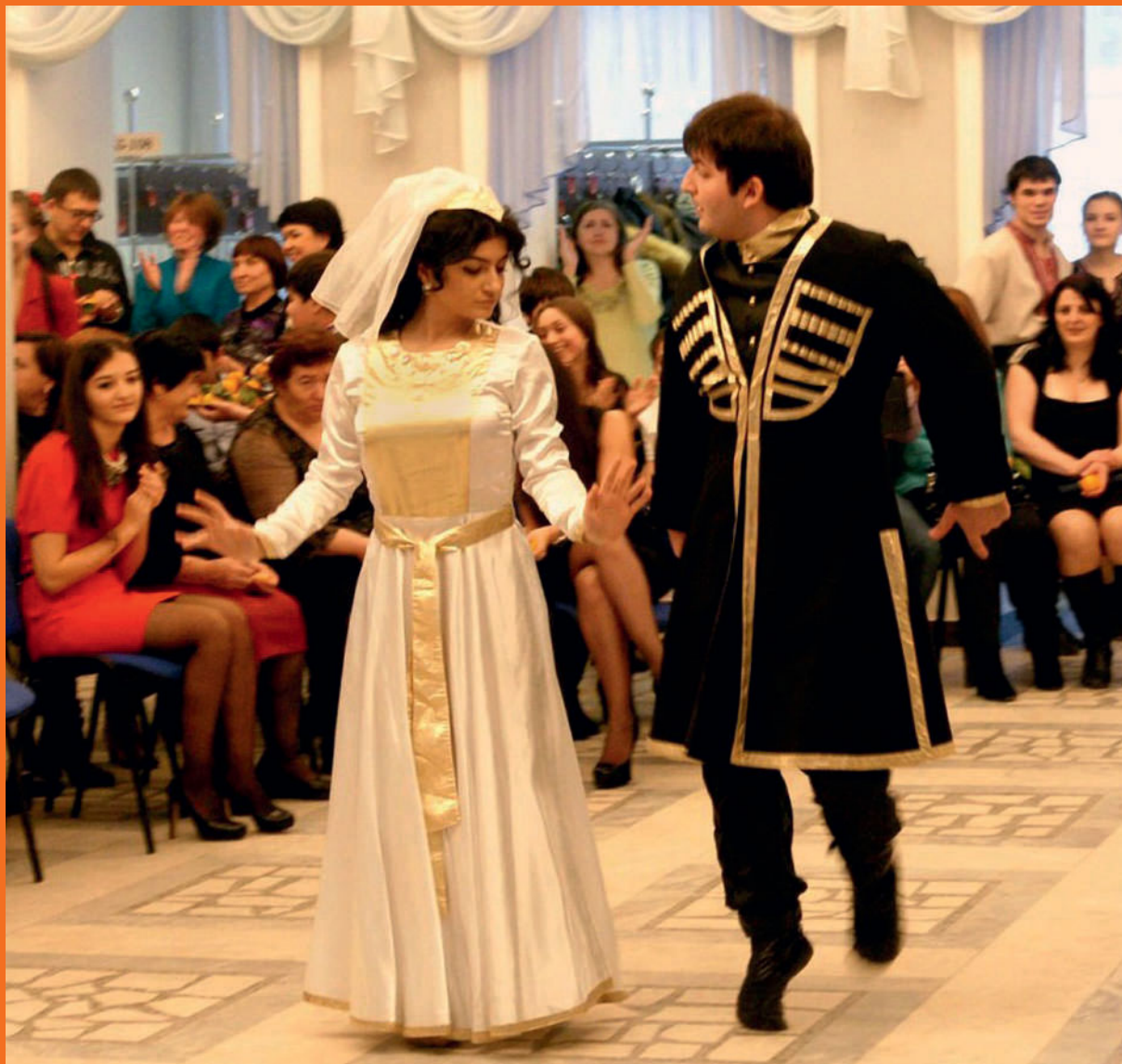
Национальный грузинский танец «Дайси» в исполнении ансамбля «Иберия», 2013 год