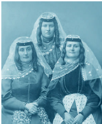
Грузинские женщины в традиционных костюмах. Начало XX века

Численность грузин в мире – около 4 млн человек. Помимо России они живут ещё в Турции (150 тыс. человек), Иране (62 тыс. человек) и на Украине (35 тыс. человек).