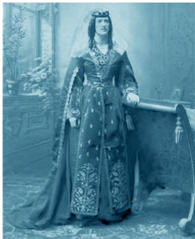
Грузинка в национальном костюме. Начало XX века

Расширение геополитического влияния Российской империи в XVIII веке привело к заключению