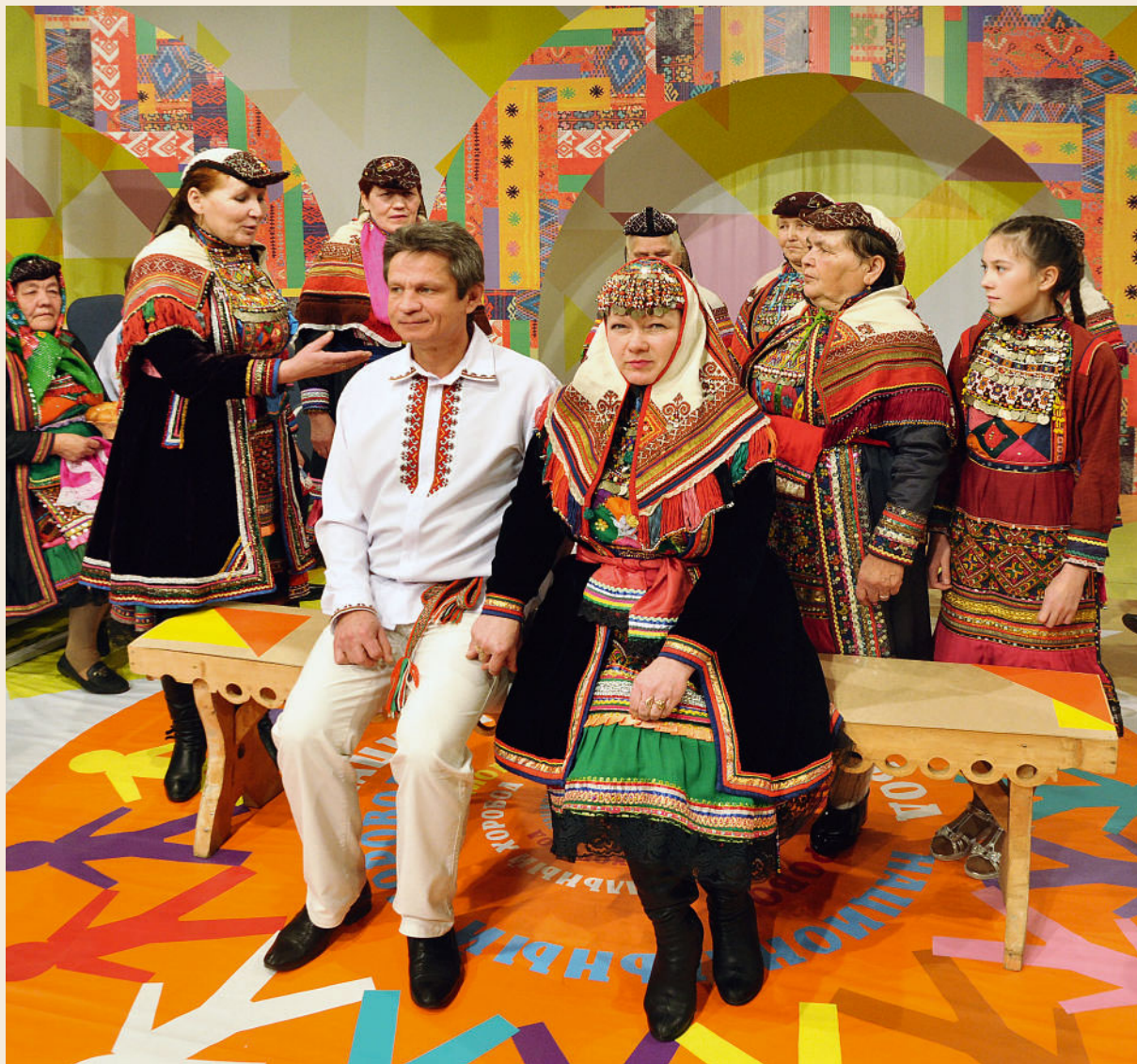
«Марийская свадьба». Пермские марицы на телепередаче «Национальный хоровод». 2015 год