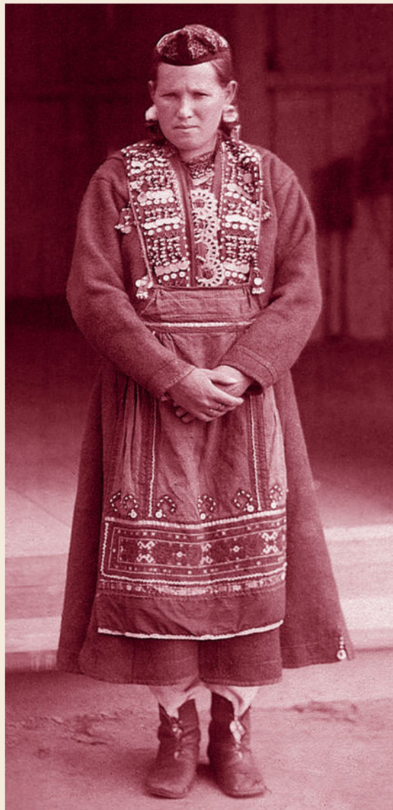
Традиционный марийский костюм. Пермская губерния, Красноуфимский уезд. Начало XX века