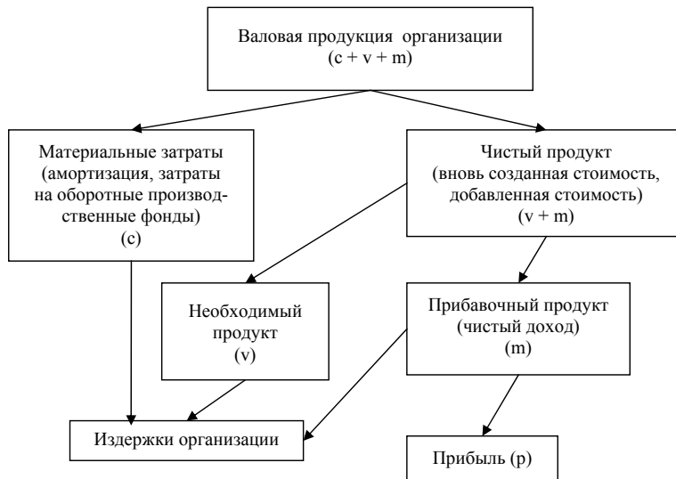
Рис. 1.2. Структура результатов воспроизводства на микроуровне 1