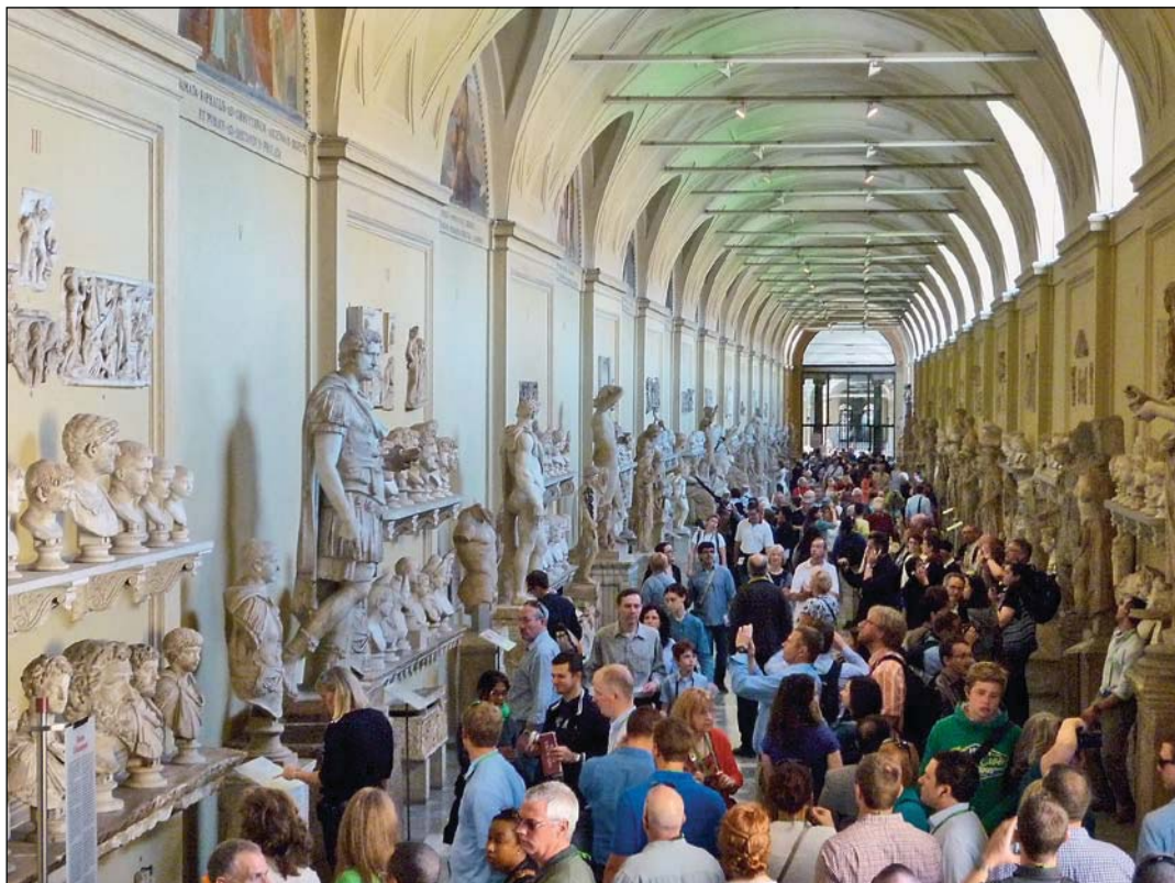
Галерея музея Кьярамонти (что значит «Коридор»), основанного папой Пием VII в 1805—1807 годах. Здесь хранятся археологические находки — около 800 экспонатов, относящихся к Римской эпохе. Музеи Ватикана. Рим.

но сочетается с характером современной культуры и, особенно, с культурой хозяйственной жизни, с высоко технологичными областями производства».