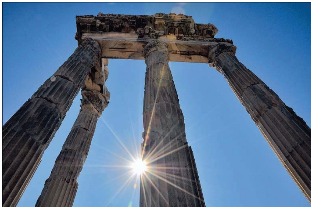
Пергам. Акрополь. Колонны храма Траяна.

эти достижения касались лишь духовной жизни и плоды принесли далеко не сразу. В материальном плане влияние ранних цивилизаций сохранялось несравненно дольше.