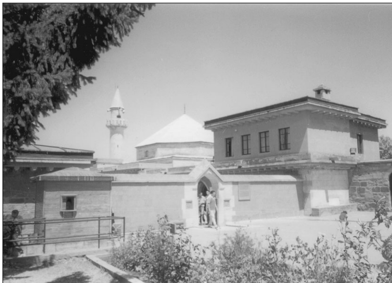
Обитель Хаджи Бекташа Вели в Сулуджа Карагююке. Современный вид.

ство 1 . Анатолию в тот период сотрясали межплеменные столкновения и смуты, направленные против династии Сельджукидов. Складывавшийся в этих условиях культ святых-вели включил в себя многие верования, не связанные напрямую с теософией тарикатов и зачастую далекие от коранического понимания ислама. Эти верования нашли отражение и в «Вилайет-наме» и в «Макалят-и Хаджи Бекташ-и Вели».