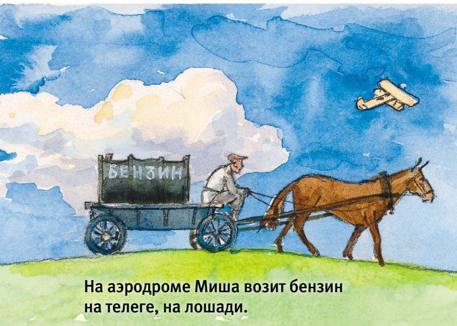
На аэродроме Миша возит бензин на телеге, на лошади.

Водить автомобиль Водопьянов учился сам, без инструктора.