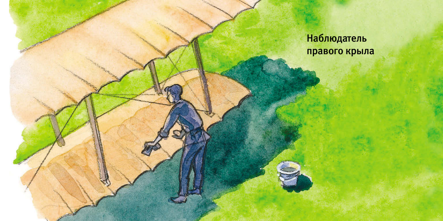
Наблюдатель правого крыла