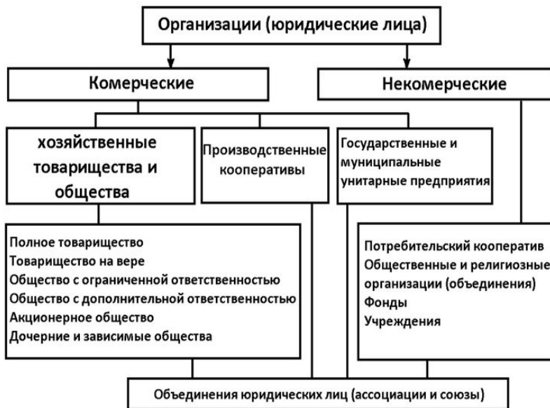
Рис.1. Классификация организаций как юридических лиц

В дальнейшем под словом организация или предприятие подразумевается формальная коммерческая организация.