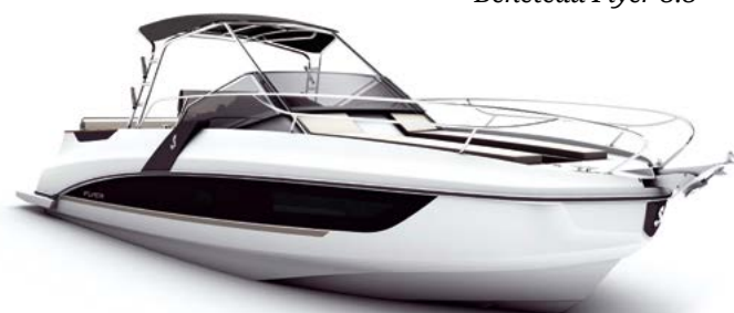
Beneteau Flyer 8.8