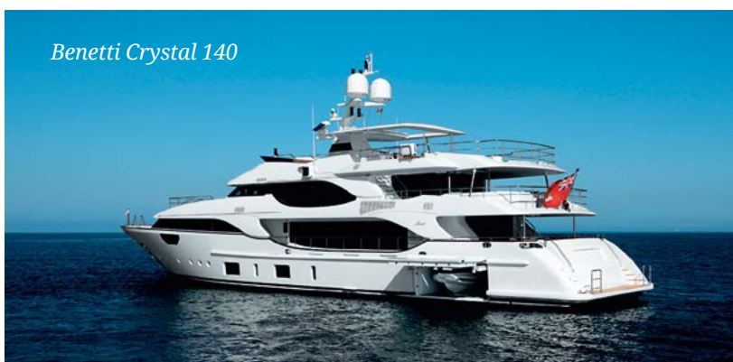
Benetti Crystal 140

Для лучшего увеселения публики в рамках фестиваля проведут несколько любопытных мероприятий. Уже ставший обычным парад яхт дополнится новым элементом. Кроме грациозно дефилирующих новинок разных верфей, в параде примут участие ретрояхты, разбитые на три основных группы: суда до 1975 г.в., с 1976 по 2000 г. и, наконец, суда, построенные после 2000 г. Для них также предусмотрены различные награды. Сама идея, безусловно, интересная. Кроме того, посетители станут зрителями первой в своем роде регаты на гребных досках (SUP — Stand Up Paddleboard). Особенность этих соревнований заключается даже не в том, на каких плавсредствах она будет проводиться, »