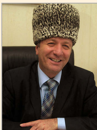
министр культуры ЧР