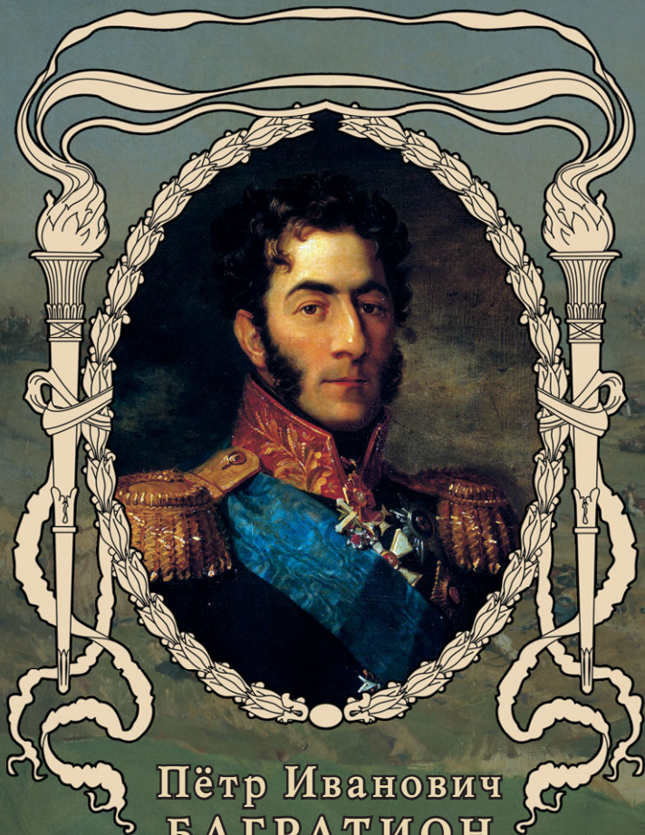
Пётр Иванович БАГРАТИОН 1765–1812