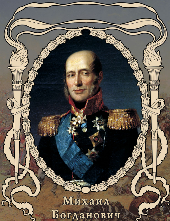
Михаил Богданович БАРКЛАЙ-ДЕ-ТОЛЛИ 1761–1818