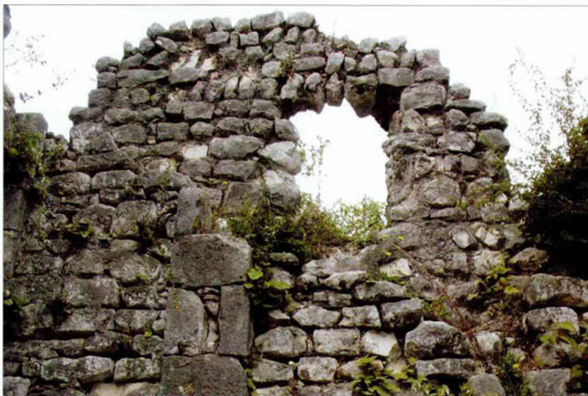
Руины нагорной крепости