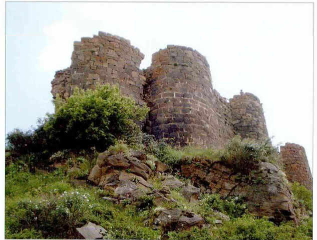
Вид на крепость

В крепости сохранились вишапы – причудливые каменные изваяния рыб, которыми обычно отмечали истоки ирригационной системы.