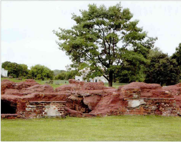
Руины Белого дворца