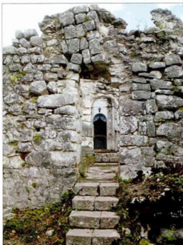
Вход в цитадель

По данным археологии, в VI–V вв. до н. э. южный склон Анакопийской (Иверской) горы был обитаем.