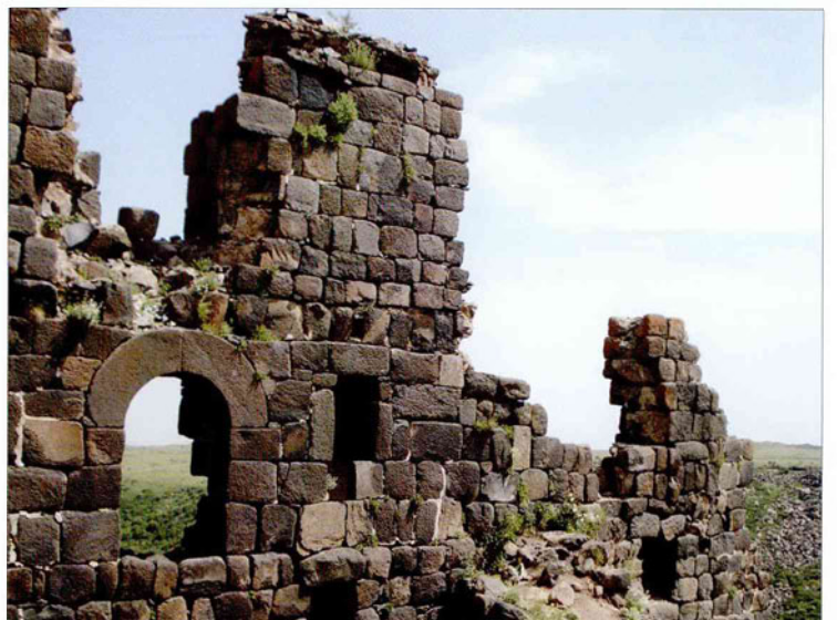
Руины древней крепости