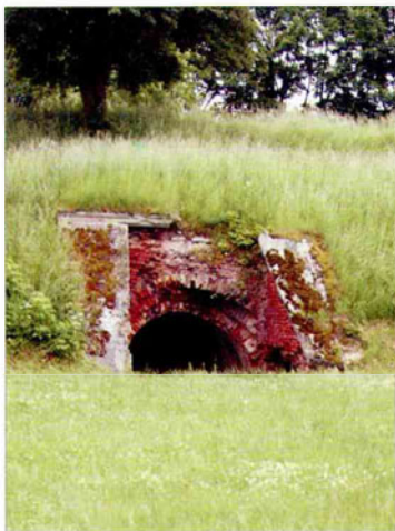
Окопы Брестской крепости

В декабре 1832 г. для реставрационных работ были созданы военно-рабочая и арестантская роты Инженерного ведомства.