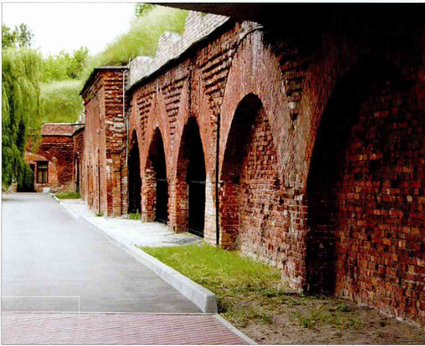
Вал Кобринского укрепления