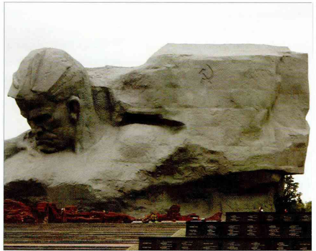
Главный монумент мемориального комплекса