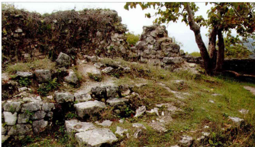
Каменная кладка, сохранившаяся до наших дней

В 1032 г. Анакопия была захвачена византийцами. Они завладели крепостью хитростью и вероломством и удерживали ее 41 год. Тогда же она лишилась статуса столицы: последний абазский царь Феодосий Слепой не оставил наследника, и на престол взошел грузинский царь Баграт III Багратиони, перенесший столицу в Кутаис.