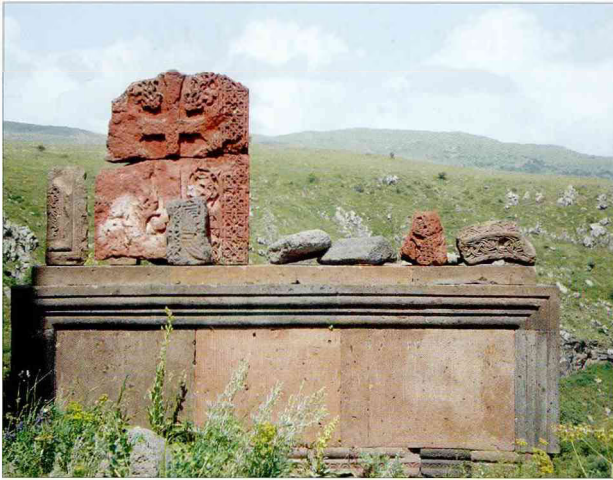
Древний хачкар, установленный у церкви