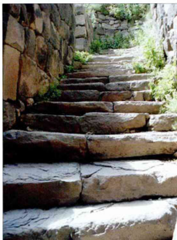
Каменная лестница, ведущая в крепость

В X–XIII вв. крепостью владели князь Пахлавуни.