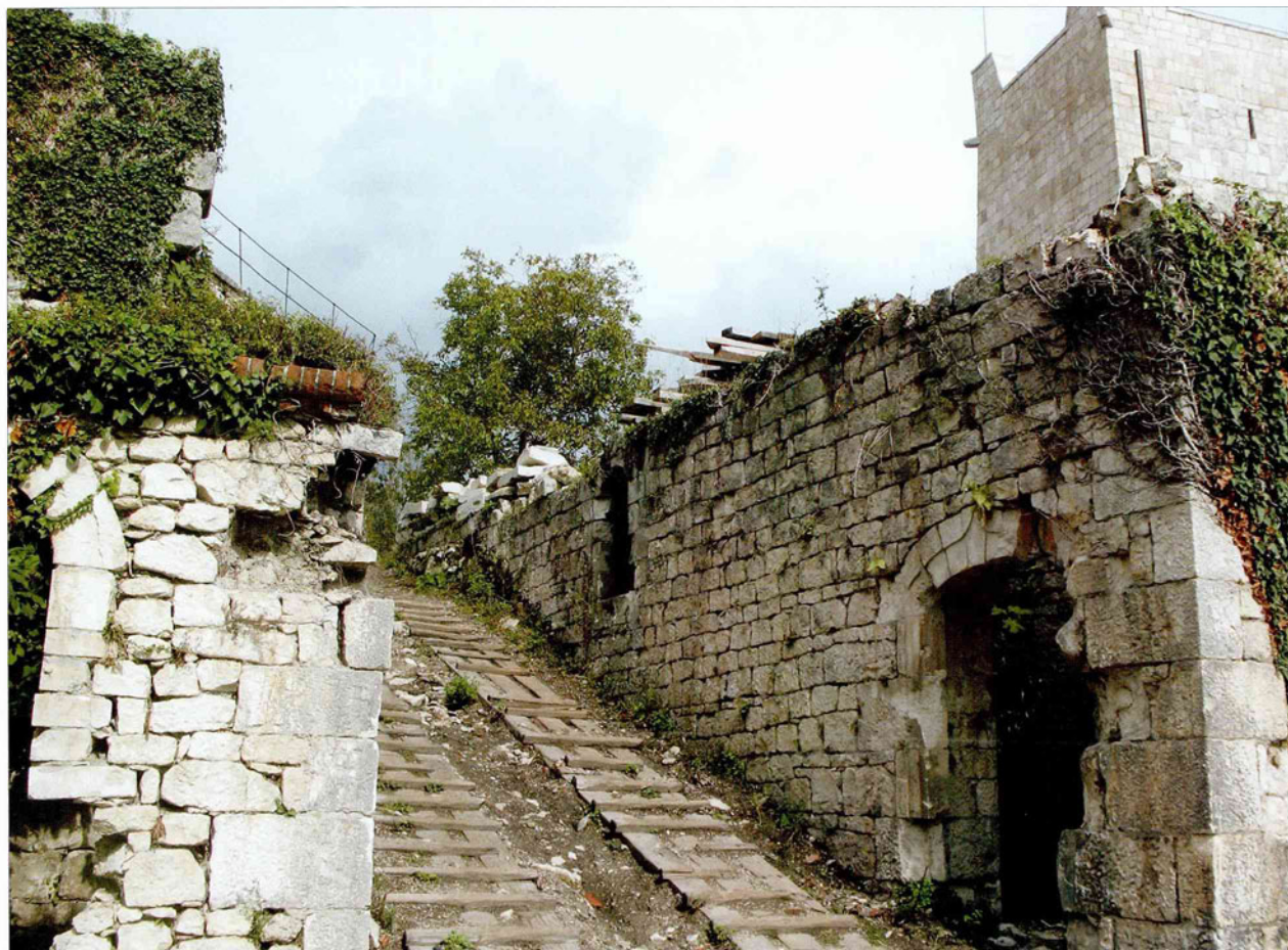
Внутренний двор крепости

Цитадель Анакопия – неприступная крепость на вершине одноименной горы в Абхазии. По данным археологии, в IV веке местные племена основали здесь укрепленное со всех сторон крепостными стенами городище Анакопию, первое упоминание о котором в письменных источниках относится к V веку.