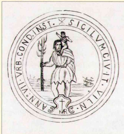
Древний герб города Вильно

Все это давало Гедимину право называться великим князем литовским и русским.