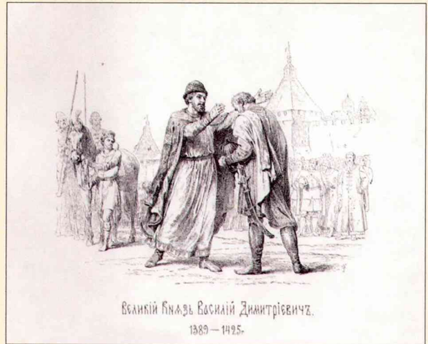
Великий князь Василий Димитриевич. 1389 – 1425.

Хищники татары беспощадно пустошили русские земли, творили всюду страшные зверства. Например, рассказывают о таком случае: в 1411 году татары и дружина Даниила Борисовича подкрались к городу Владимиру в ту пору, когда все жители спали, захватили городское стадо, взяли посады и сожгли их, множество людей избили. В соборной церкви заперся священник; он собрал, сколько мог, драгоценных церковных вещей, спрятал все это в церкви, скрыл здесь и несколько человек, а сам стал со слезами молиться пред образом Богородицы. Татары прискакали к церкви и стали кричать, чтобы ее отперли. Священник стоял неподвижно и молился... Татары разбили дверь, ворвались в собор, содрали ризы с икон, ограбили всю церковь, а священника стали пытаться, доби-