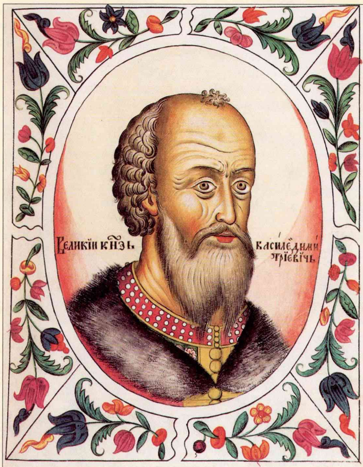
Великий князь Василий Дмитриевич Царский титулярник