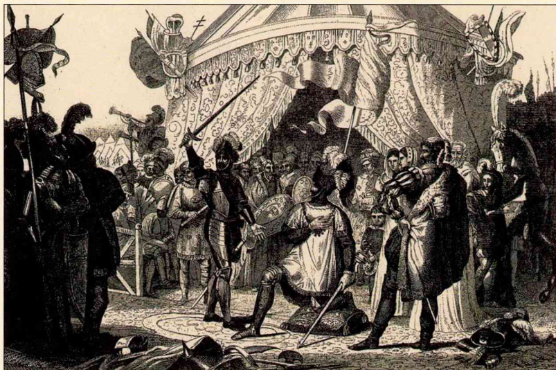
Сцена из рыцарских времен

тут, как всегда, с присущей им настойчивостью и последовательностью. Как ни злобились пруссы, как отчаянно ни противились тевтонам, но, раздробленные, не имевшие общего вождя, не могли устоять... Зато далее на востоке орден встретил сильный отпор от Литвы, во главе которой теперь стоял князь, способный бороться, где можно – силою, где надо – хитростью, понимавший, что для борьбы с немцами – сильным врагом всех литовских племен – необходимо их сплотить в одно целое. Это был Миндовг, по словам современников, «хищный, как волк, и хитрый, как лисица». Ему пришлось вести войну и на севере с Ливонским орденом, от которого он хотел оборонить жителей Курляндии и подчинить их своей власти, и на юге – с Даниилом Романовичем Галицким, да вдобавок надо было еще бороться с родичами. Справиться со всеми врагами внешними и внутренними было Миндовгу не под силу. Тогда он, чтобы склонить в свою пользу ливонского магистра, выразил желание принять христианство и действительно крестился. Обрадованный папа прислал в 1252 году королевскую корону Миндовгу, который выставлял себя покорным сыном его, святейшего отца, а пред рыцарями рев-