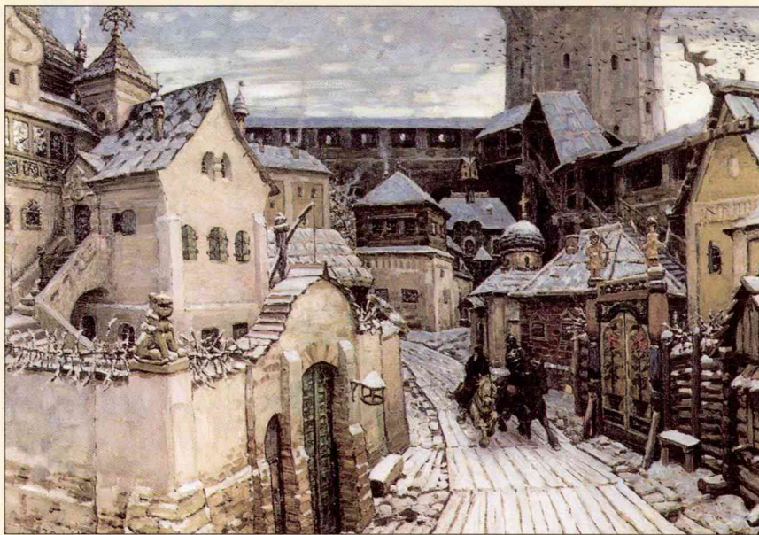
А. Васнецов Гонцы. Утро в Кремле

запустели. Кто избавился от смерти сам, тому пришлось оплакивать смерть близких людей и гибель своего имущества.