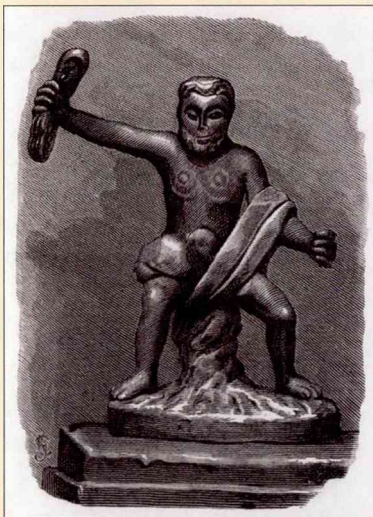
Литовский бог Перкунас

Главное место богослужения, так называемое Ромново (что значит место покоя и благочестия), устраивалось в роще у большого дерева. Под ветвями векового дуба стоял здесь идол Перкуна, изображавший мощного мужа с кремнем в руке; с одной стороны его ставили Поклуса в виде безобразного старца, держащего черепа человеческий и животных, а с другой – Атримпоса,