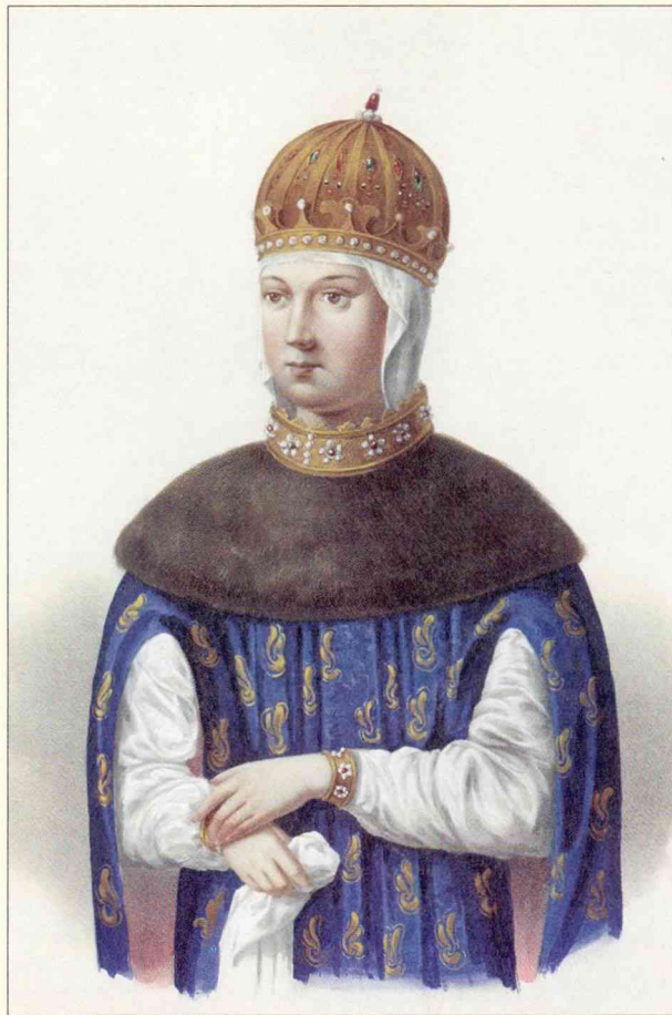
Царица Мария Ильинична Милославская, супруга царя Алексея Михайловича Романова

Затем чернь бросилась на дома других нелюбимых сановников: одна толпа раз-