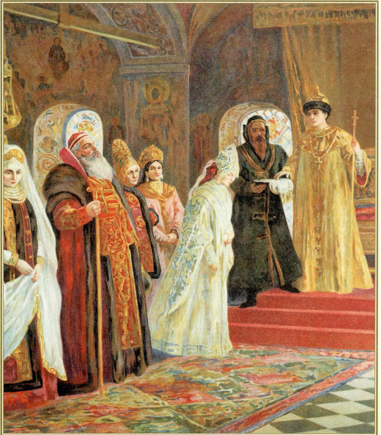
К. Маковский Выбор невесты царем Алексеем Михайловичем

Простой обморок признали припадком падучей болезнью. Вместо великой чести, которая ожидала Всеволожских, всю семью их постигла царская опала: они были обвинены в том, что скрыли болезнь