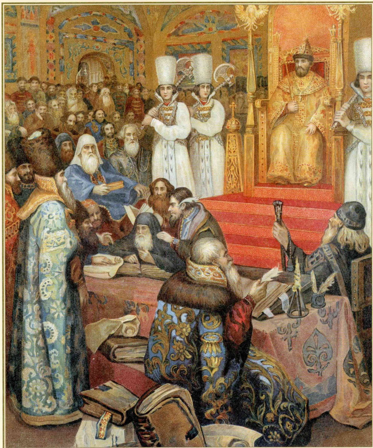
Н. Некрасов Соборное уложение. 1649 год