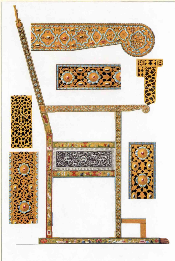
Ф. Солнцев Кресло царя Алексея Михайловича

После усмирения мятежа Остранина и Гуни казацкая сила была, по-видимому, вконец сокрушена, но это только казалось.