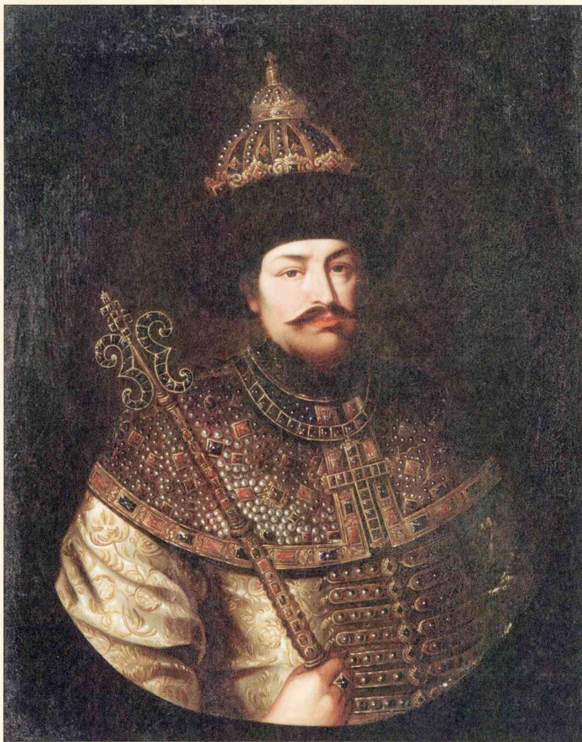
Неизвестный художник Портрет царя Алексея Михайловича

поборы, принесла больше вреда, чем пользы. Соль вздорожала, и рыбный промысел упал. Соленая рыба потреблялась русским народом в огромном количестве, гораздо большем, чем говядина; объясняется это соблюдением многих постов и любовью русских к рыбным кушаньям. Теперь же рыбные промышленники уменьшили свой промысел, стали недосаливать рыбу, и она портилась. Соленая рыба страшно поднялась в цене, и сбыт ее сильно уменьшился: потребители не в силах были покупать дорогосто-