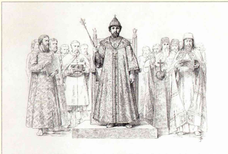
В.П. Верещагин Самодержавец царь Алексей Михайлович

В ту пору шведский агент в самом деле вез часть денег, уплаченных за перебежчиков. Толпа кинулась на него, отобрала у него деньги и бумаги, а самого посадила под стражу. Напали и на двор москов-