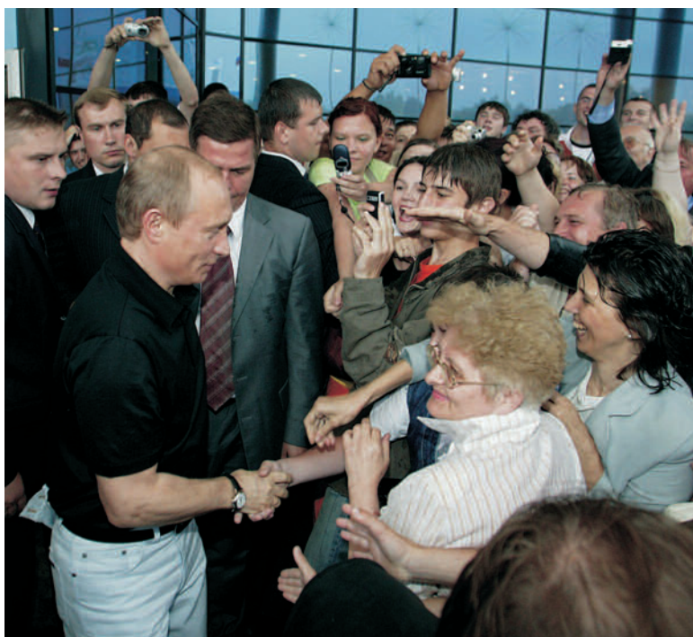
Чехов, Московская область. Даже ливень не помеха для сердечного общения.