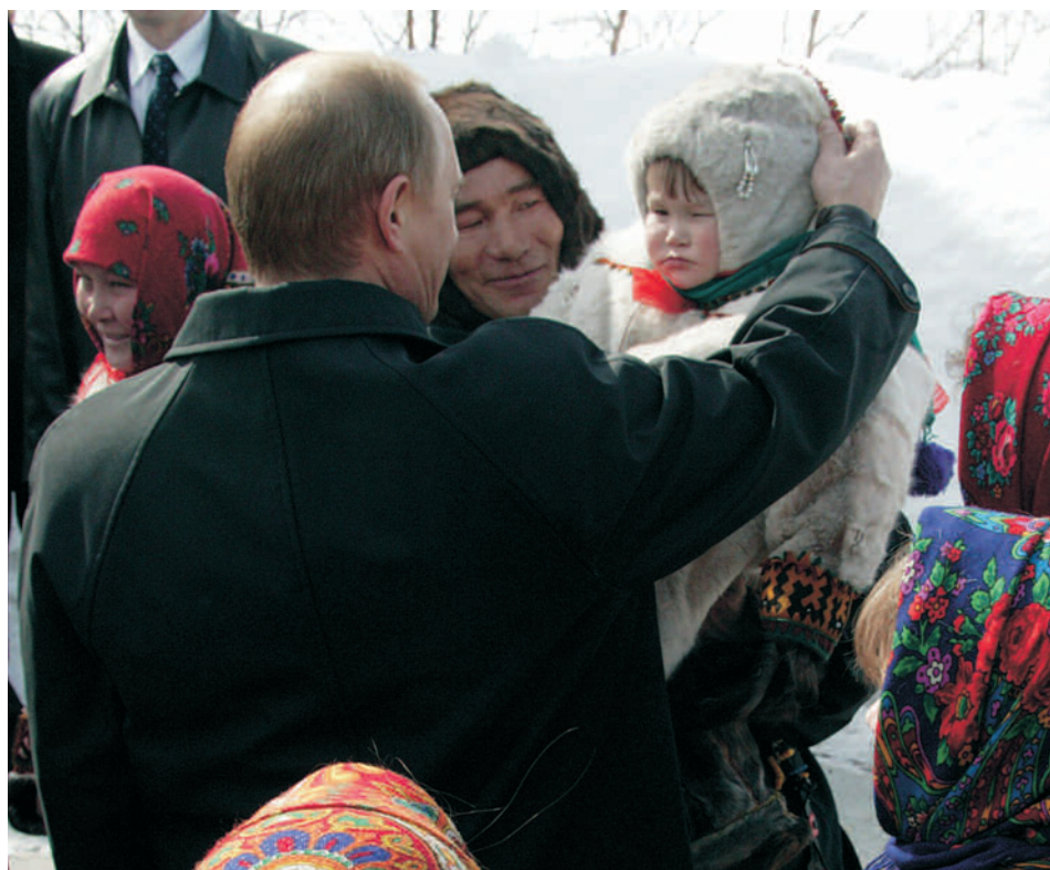
Салехард. На Ямал президент прибыл обсудить проблемы северян.