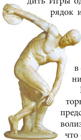
Скульптор Мирон Статуя дискобола

Постоянным атрибутом Олимпиады является олимпийский огонь, который горит, пока не закончатся Игры. Символ Игр – олимпийский флаг, представляющий собой белое полотнище с пятью кольцами, которые символизируют пять континентов. Олимпийский девиз – «Citius, altius, fortius», что означает «Быстрее, выше, сильнее». С 1920 г. стало традицией произнесение олимпийской клятвы спортсменом, представляющим страну – хозяйку соревнований.