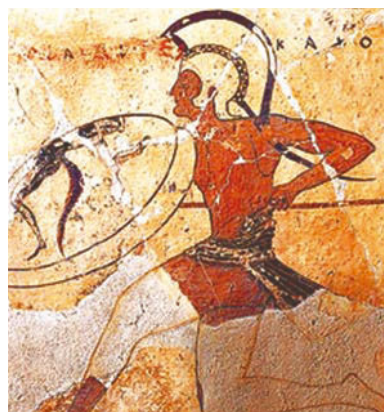
Обязательный вид олимпийских состязаний – бег воинов в тяжелых доспехах