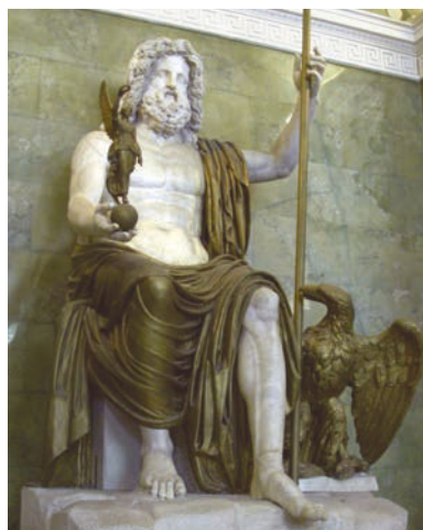
Статуя Зевса – покровителя спортивных состязаний Храм в Олимпии